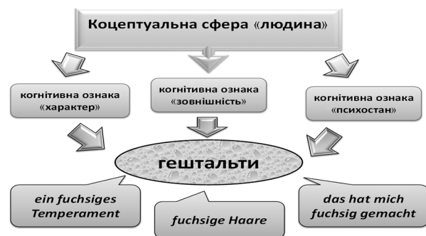
Схема 3. Когнітивний гештальт

Тому когнітивний гештальт можна уявити у вигляді схеми 3 .