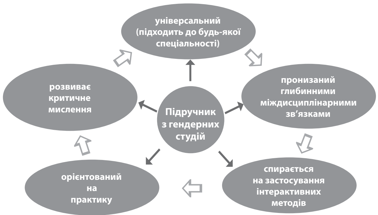
Рис. 1. Модель сучасного підручника з гендерних студій

Висновки. Підручник з гендерних студій має стати універсальним сучасним підручником, що спирається на останні наукові дослідження у галузі гендерних знань, глибинні міждисциплінарні зв'язки, критичне мислення, інтерактивні методи навчання та практику сьогодення. Однак