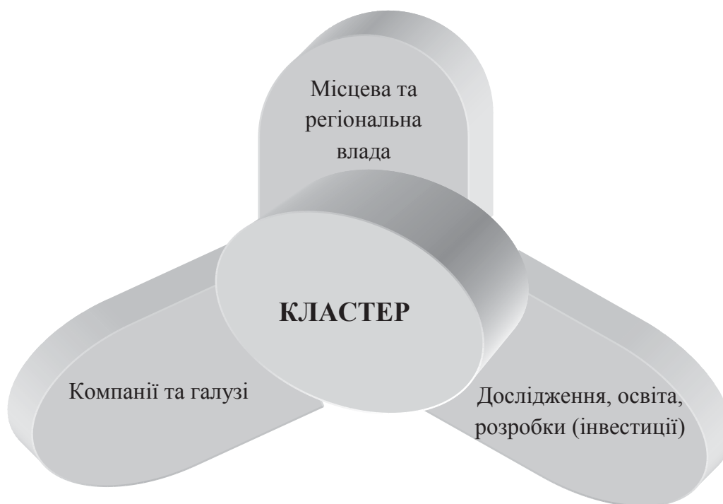
Рис. 2. Модель детермінант «потрійна спіраль» Г. Етцковича

На відміну від теорії М. Портера, М. Енрайт вважає, що конкурентні переваги створюються на регіональному рівні і за-