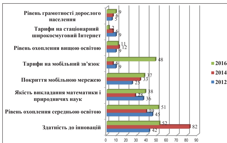
Рис. 2. Рейтингові позиції за показниками, що сприяють розвитку ІТ-сфери в Україні [9–11]

Формуванню ефективного конкурентного середовища для розвитку ІТ-сфери сприяють такі ключові фактори, як створення ефективного режиму правового регулювання; відкрита економіка, заснована на конкуренції; активна участь держави в досягненні необхідного балансу між роз-