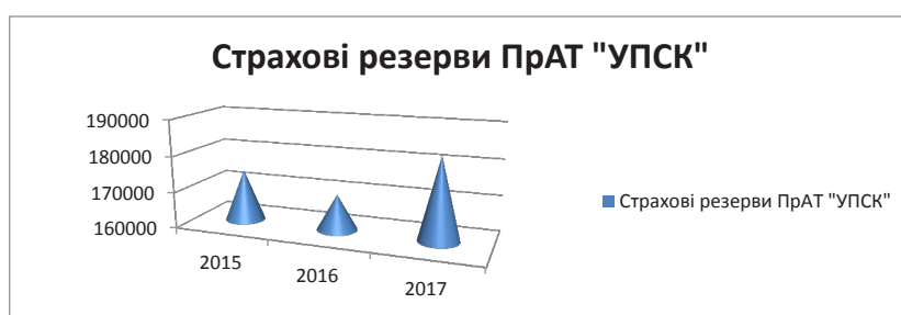
Рис. 1. Страхові резерви ПрАТ «УПСК» за 2015–2017 рр., тис. грн.

Відзначимо, що за результатами дослідження фінансовий стан підприємства є нестабільним. Проте навіть той факт, що основні показники балансу страхової компанії зменшилися, це відбувається рівномірно, а це призводить до думки, що таке явище могло бути викликане