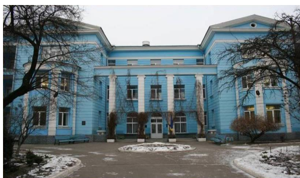
Рис. 1. Будівля закладу дошкільної освіти № 1 «Орлятко» заводу «Арсенал» у рік відкриття (1940 р.) та наші дні (фото із фондів архіву ЗДО № 1 «Орлятко»)