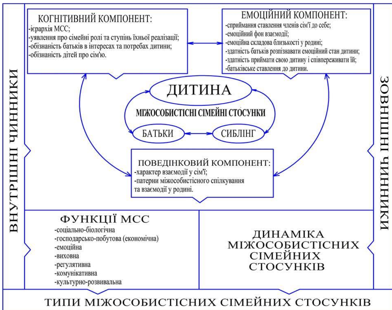
Рис. 1. Структурно-функціональна модель міжособистісних сімейних стосунків

Репрезентована модель ґрунтується на уявленнях про систему міжособистісних сімейних стосунків, в яких центром міжособистісної взаємодії виступають взаємопов'язані дитячо-батьківські, подружні та сиблінгові взаємини. Якісними характеристиками окресленого конструкту є когнітивний, емоційний та поведінковий компоненти, які визначаються показниками успішного функціонування сім'ї. Функціонування вищезазначеної системи є динамічною взаємодією, що презентується функціями сім'ї (соціально-біологічною, господарсько-побутовою, емоційною, виховною, регулятивною, комунікативною, культурно-розвивальною), обумовлена чинниками (внутрішніми та зовнішніми), які разом визначають їхні типи.