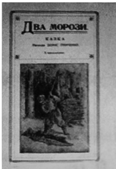
Рис. 3. Обкладинка і полосна ілюстрація до казки Б. Грінченка «Два морози» (гравюра), 1914 р. Художник Ю. Михайлів

Яскрава індивідуальна манера оформлення книг, автором яких був Б. Грінченко, притаманна видатному українському архітектору і художнику Василю Кричевському. Художник знаходився під впливом змісту творів свого першого вчителя, який у 1884–1885 роках працював у початковому народному училищі села Нижня Сироватка (нині Сумська область), де