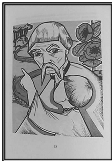
Рис. 20. Обкладинка і полосна ілюстрація до оповідання Б. Грінченка «Олеся», 1977 р. Художник Н. Мудрик-Мриц