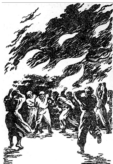
Рис. 10. Обкладинка і поєднана ілюстрація до творів Б. Грінченка «В темную ночь», «Под тихими вербами» (гравюра), 1961р. Художник С. Соколов

Виконане в єдиному стилі загальне оздоблення книги і пишно прикрашені декором ілюстрації створюють цілісний гармонійний образ, яскраво відтворюють характерні особливості українського побуту. Певна монументальність образів, умовність зображення простору, вираженість композиційного рішення ілюстрацій, вишукана стилізація, округлість і «співучість» контурів фігур, пружний і водночас «м'який» штрих гравюри надають виданню надзвичайної краси та довершеності, доповнюють та збагачують емоційну виразність твору (рис. 11).