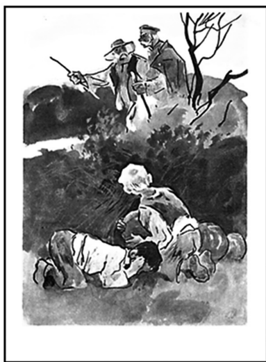
Рис. 16. Полосна ілюстрація до оповідання Б. Грінченка «Кавуни» (акварель, туш), 1985 р. Художник В. Євдокименко

Особливої уваги заслуговує ілюстрація, що висвітлює кульмінаційний момент твору. Художник обрав надзвичайно цікаве композиційне рішення, у якому не видно облич маленьких крадіїв, що (як би здавалося) допомогло якнайкраще передати страх хлопчиків від вчиненого