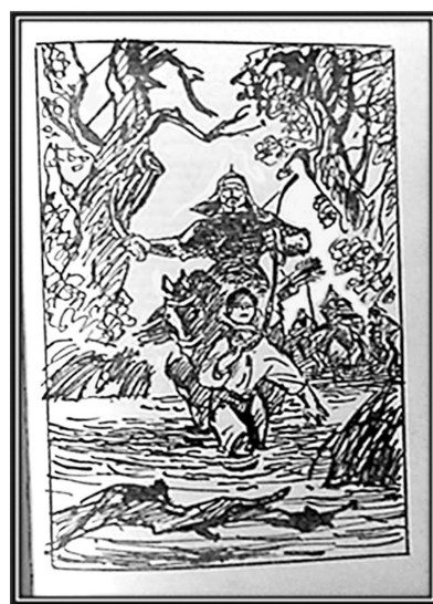
Рис. 19. Полосна ілюстрація до оповідання Б. Грінченка «Олеся» зі збірки «Зернятка» (туш, перо), 1989 р. Художник В. Євдокименко

У 1977 році поетеса, видавець, художниця-графік Ніна Мудрик-Мриць, яка довгий час працювала в українських дитячих журналах «Готуйсь» та «Веселка» (пізніше переїхала до Канади), запропонувала власний варіант ілюстрацій до твору Б. Грінченка «Олеся», виданий