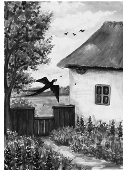
Рис. 30. Ілюстрації до віршів «Ранок» і «Ластівка» з посібника «Хрестоматія для додаткового читання. 4 клас», упорядник Н. Богданець-Білоskalенко, 2015 р. Художник — студентка Інституту мистецтв Київського університету ім. Б. Грінченка Н. Мудренко