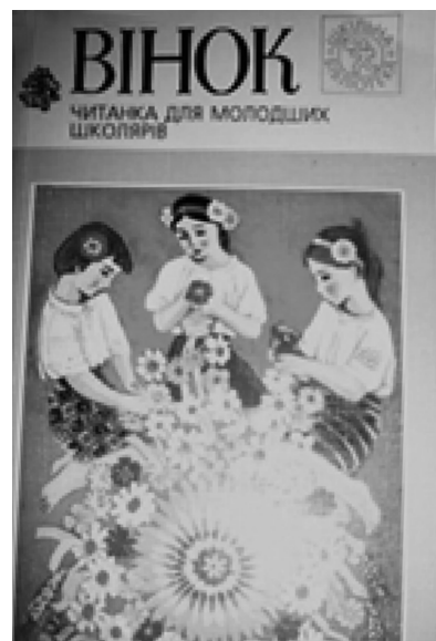
Рис. 2. Реставрація обкладинки до читанки Б. Грінченка «Вінок», 1998 р. Художник М. Компанець