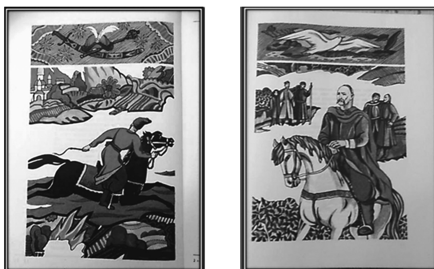
Рис. 24. Полосні ілюстрації до збірки «Лесь, преславний гайдамака», 1991 р. Художники Г. Журновська і К. Музика