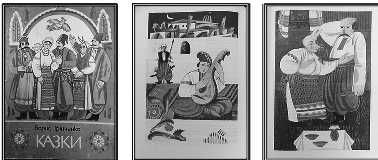
Рис. 22. Обкладинка й полосні ілюстрації до оповідань «Дума про княгиню-кобзаря» і «Три бажання» зі збірки «Казки», 1990 р. Художники Г. Журновська і К. Музика