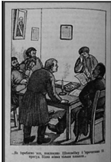
Рис. 8. Полосні ілюстрації до оповідання Б. Грінченка «Хата» (гравюра), 1927 р. Художник П. Лапін

навколишнього світу (паркан, будинки, дерева та ін.), контраст чорних та білих плям створюють щільний простір, де переважають стихія, енергія, рух, — тим самим допомагають відтворити складний художній образ, в якому художник майстерно демонструє розбурхане природне лихо (рис. 9).