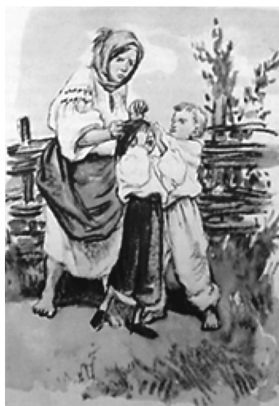
Рис. 13. Полосні ілюстрації до оповідання Б. Грінченка «Ксеня» (акварель), 1962 р. Художник І. Філонов