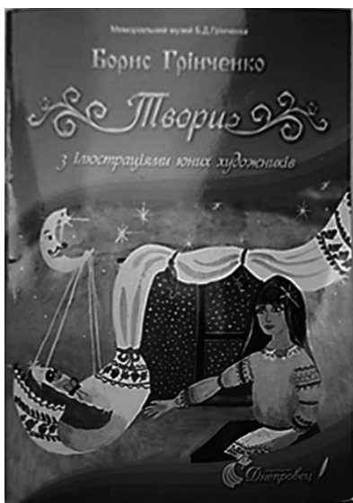
Рис. 29. Обкладинка до книги «Твори з ілюстраціями юних художників», 2014 р. Автори ілюстрацій — юні художники Перевальського району Луганської області

Б. Грінченка «Твори» (Верхньодніпровськ, видавництво «Дніпровець»), виданої до 100-річчя вшанування пам'яті письменника. Ілюстрації до книги були створені зовсім юними митцями — сучасними школярами Перевальського району Луганської області (рис. 29).