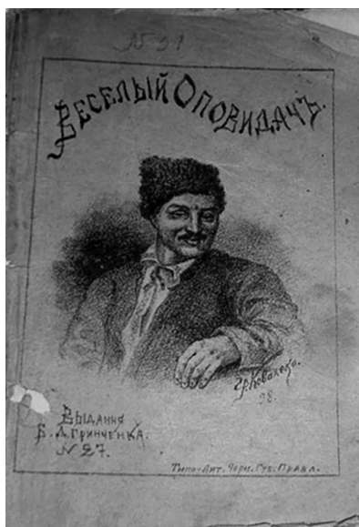
Рис. 4. Обкладинка до твору Б. Грінченка «Веселий оповідач» (гравюра), 1918 р. Художник Г. Коваленко

в цей період навчався В. Кричевський [4, с. 120]. Митець оформив кілька видань Б. Грінченка. Так, 1919 року в Києві видавництвом «Всеукраїнський кооперативний видавничий союз» була надрукована збірка оповідань Бориса Грінченка «Соняшний промінь», обкладинку якої розробив В. Кричевський.