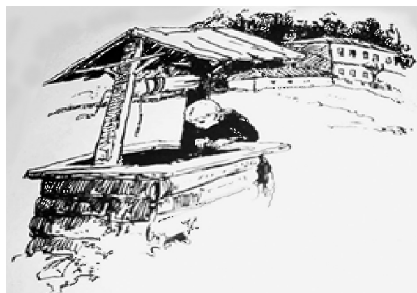
Рис. 15. Ілюстрація до оповідання Б. Грінченка «Дзвоник» (перо, туш), 1969 р. Художник М. Стороженко

Творчість Б. Грінченка не залишила байдужим і відомого українського художника Василя Євдокименка, який у 80-х роках минулого століття плідно працював у галузі книжкової графіки у видавництві «Веселка». Митець проілюстрував оповідання «Кавуни» (1985 р.), «Україна» (1988 р.) й оформив збірку творів письменника «Зернятка» (1989 р.).