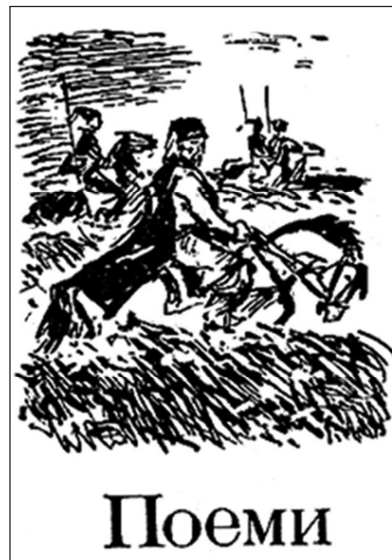
Рис. 18. Обкладинка, титул та шмуцтитул до збірки Б. Грінченка «Зернятка» (туш, перо), 1989 р. Художник В. Євдокименко

ника-загарбника, додає гостре відчуття беззахисності маленької героїні.