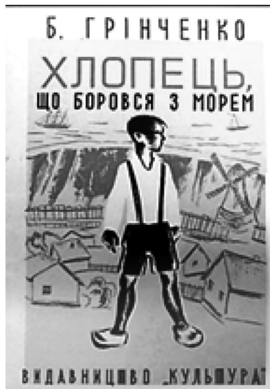
Рис. 9. Обкладинка і полосна ілюстрація до оповідання Б. Грінченка «Хлопець, що боровся з морем» (гравюра), 1930 р. Художник Г. Дін

Тридцять років потому художниця Катерина Щепкіна представила власне трактування літературних образів роману «Під тихими вербами», виданого київським видавництвом «Радянська школа» (1991 р.).