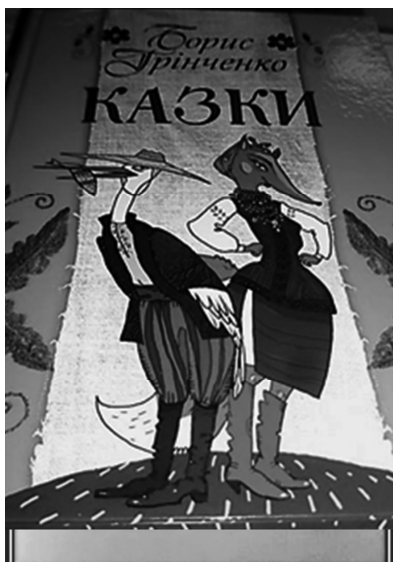
Рис. 27. Обкладинка до книги «Казки», 2013 р. Художник Оксана Федько