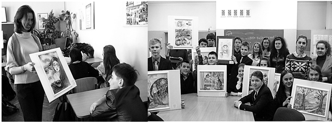
Рис. 35. Зустріч студентів-грінченківців зі школярами

рами Б. Грінченка працювали І. Крашевський («Думи кобзарські», 1897 р.), Н. Соболь («Се-стриця Галя», 1930 р.), О. Губарев («Без хліба», 1958 р.), Г. Акулов («Без хлеба», 1960 р.), Б. Назаренко («Поезії, повісті, оповідання», 2002 р.). Використовуючи розмаїття художніх технік, митці індивідуально підходять до вирішення образів літературних персонажів, створених