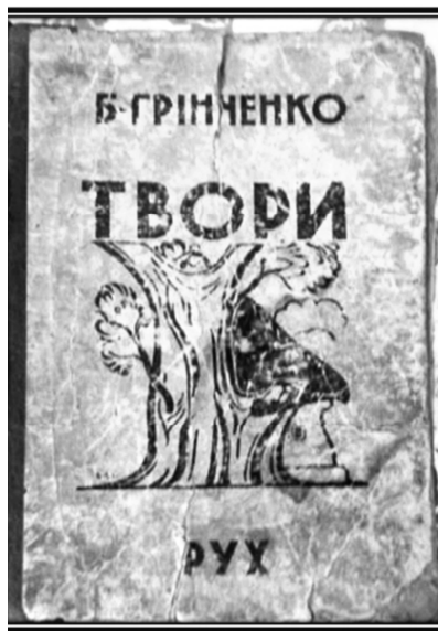
Рис. 6. Обкладинка збірки оповідань Б. Грінченка «Твори» (гравюра), 1931 р. Художник В. Кричевський

Пластична мова, до якої вдався художник, близька до експресіонізму. Маси неба, моря, дамби, біля якої відбуваються події оповідання, динамічно взаємодіють з образами потопаючих домівок, поодиноких дерев та інших елементів зображення. Спрощені до знаковості образи