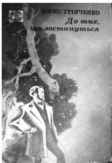
Рис. 25. Обкладинка до збірки «До тих, що зостануться», 1993 р. Художник М. Пшінка

В оформленні збірки художник тонко враховує вікові особливості дитячої читацької аудиторії: вибір композиційного рішення дає змогу не лише уважно розглянути головних героїв оповідань, а й зосередити увагу на особливостях поведінки, психологічних характеристиках