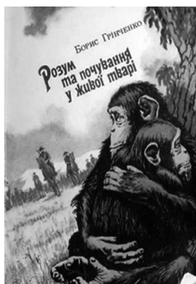
Рис. 26. Обкладинка до збірки «Розум та почування у живої тварі» та ілюстрація до оповідання «Звірі мстяться», 1994 р (1918 р.). Художник В. Зельдіс

персонажів. Тим самим художник спонукає читачів замислитися над правильністю людських вчинків стосовно тварин, про яких йдеться. Техніка гуаші, яку застосовував художник при створенні ілюстрацій, завдяки своїй яскравості й барвистості дає змогу якнайкраще зацікавити маленьких читачів, привернути їхню увагу до змісту оповідань (рис. 26).