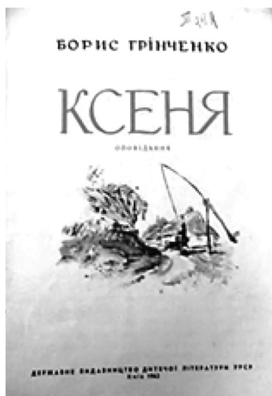
Рис. 12. Обкладинка й титул до оповідання Б. Грінченка «Ксеня» (акварель), 1962 р. Художник І. Філонов