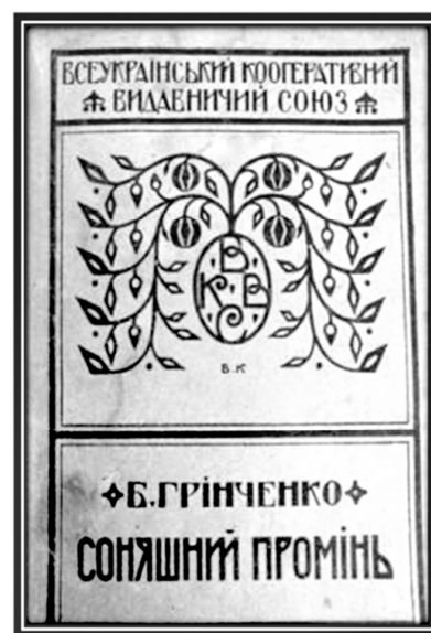
Рис. 5. Обкладинка збірки оповідань Б. Грінченка «Соняшний промінь» (гравюра), 1919 р. Художник В. Кричевський

На обкладинці дуже умовно й надзвичайно спрощено зображено лише два елементи: дуб, на якому ледь вгадуються гілки й листя, і лаконічно намальована двома плямами (білою — стіни, чорною — дах) хатинка, яка жартівливо виглядає з-за дерева. Велетень-дуб ніби оберігає хатинку від усіляких негараздів. Можливо,