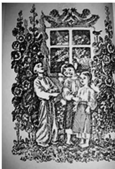
Рис. 1. Полосна ілюстрація до читанки Б. Грінченка «Вінок» (гравюра), 1911 р. Художник О. Сластіон

У Чернігові 1918 року виходить твір Б. Грінченка «Веселий оповідач». Портрет козака для обкладинки книги створений українським художником, письменником та етнографом Григорієм Коваленком у техніці літографії одра-