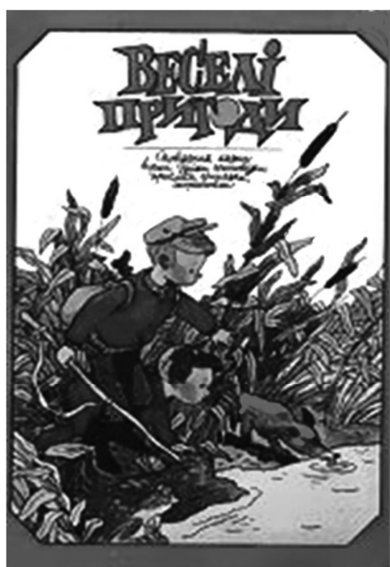
Рис. 21. Обкладинка до збірки «Веселі пригоди, оповідання, казки», 1985 р. Художник В. Боковня

доповнюють психологічну характеристику персонажів, тим самим сприяють збагаченню життєвого й художнього досвіду маленьких читачів, кращому осмисленню внутрішнього світу персонажів та їхніх вчинків. Виконані у техніці гуаші ілюстрації вирізняються певною монументальністю композиційного рішення, «тонкою» стилізацією, яскравістю й соковитістю барв. Заставки та оборочні ілюстрації із зображенням рослинних орнаментів, декоративних птахів, тварин, суто українських фольклорних образів гармонійно доповнюють художнє оформлення, додають виданню певного «народного духу», святковості й цілісності (рис. 22, 23, 24).