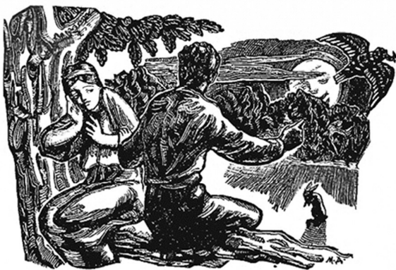
Рис. 14. Напівполосна ілюстрація до уривку «Малі заблуди» з оповідання Б. Грінченка «Ксеня» (гравюра), 1960 р. Художник М. Дмитренко

Вдумливий аналіз твору, глибоке усвідомлення внутрішнього стану семирічної сільської дівчинки-сироти допомогли художнику переконливо відтворити образ самотньої крихітки-білинки, яка будучи позбавлена батьківської ласки й турботи, опинилась у сирітському притулку великого міста. Дзвоник, за яким від-