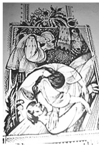
Рис. 11. Обкладинка і поєднані ілюстрації до твору Б. Грінченка «Под тихими вербами» (гравюра), 1961р. Художник К. Щепкіна