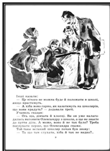
Рис. 17. Обкладинка і напівполосна ілюстрація до оповідання Б. Грінченка «Украла» (акварель), 1988 р. Художник В. Євдокименко