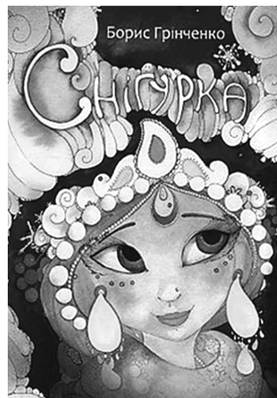
Рис. 28. Обкладинка до книги «Снігурка», 2014 р. Художник Влада Ермоленко