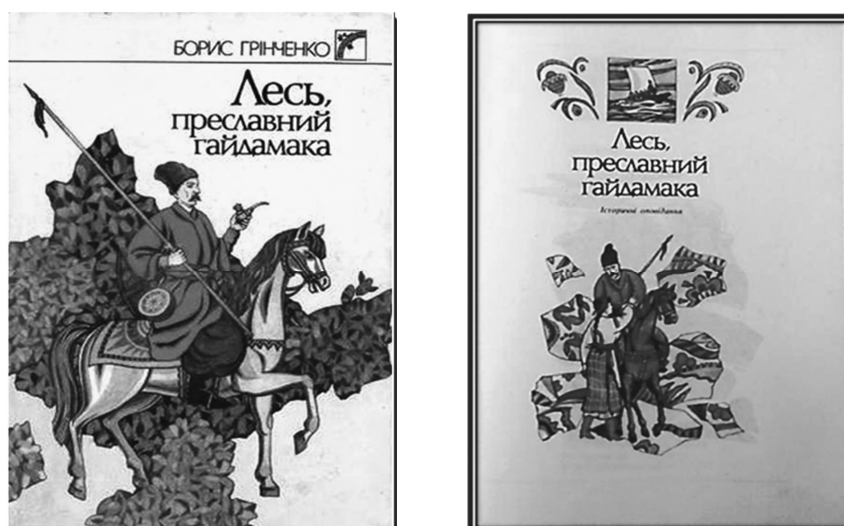
Рис. 23. Обкладинка і титульна сторінка до збірки «Лесь, преславний гайдамака», 1991 р. Художники Г. Журновська і К. Музика