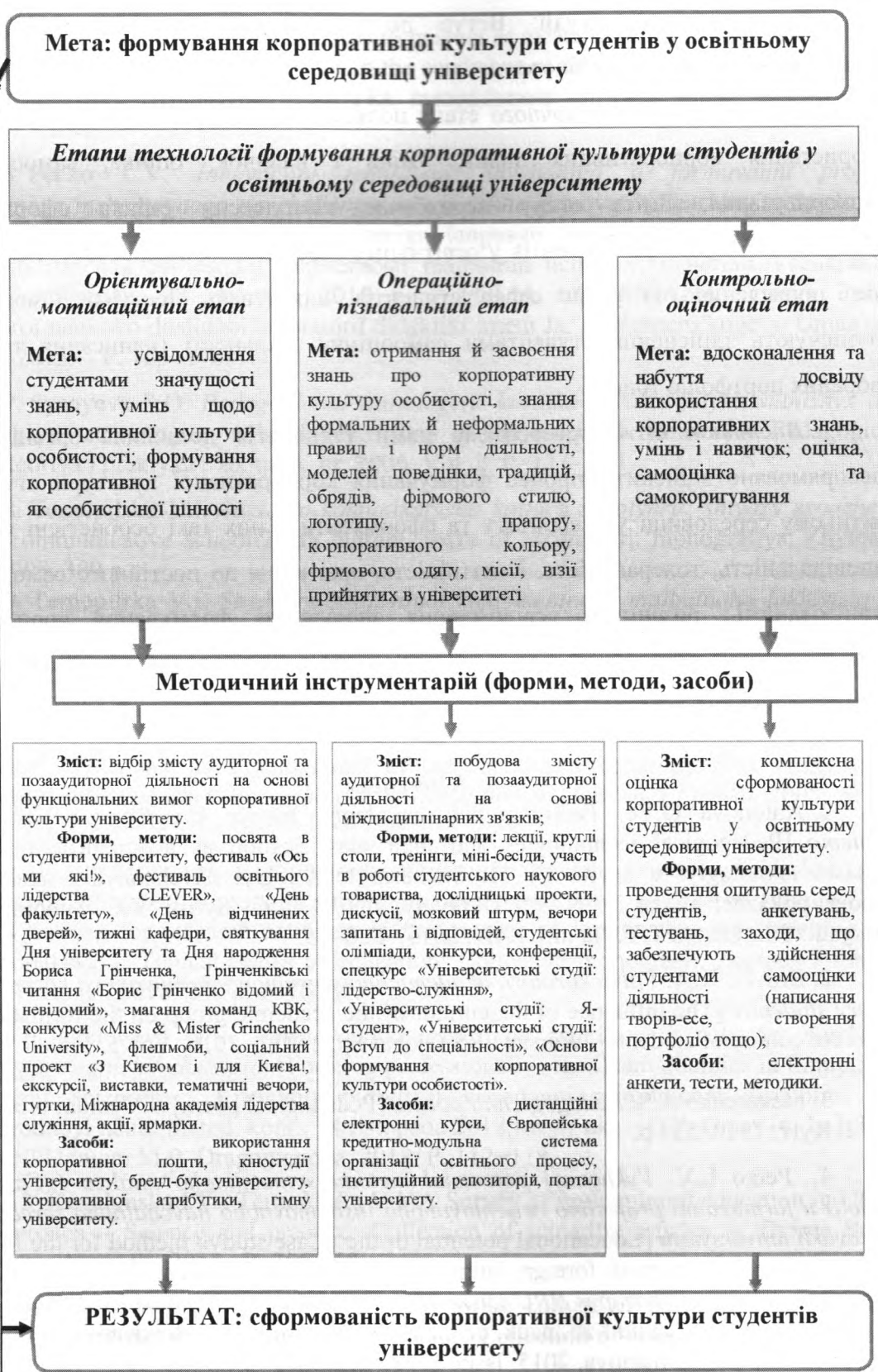
Рис. 1. Схема технології формування корпоративної культури студентів у освітньому середовищі університету

Організаційно-педагогічні умови: формування в студентській групі виховного середовища, що сприяє засвоєнню студентами умінь і навичок корпоративної культури; дослідження підтримки студентів у моральному самовизначенні, автї корпоративної культури; зміцненя належного заняття суспільно-гуманітарними спеціальностями; розвиток саморегулювання для організації суб'єкт-суб'єктної взаємодії студентів, розуміння ними суспільної та суб'єктивної необхідності та актуальності доприймання корпоративної культури у власній повсякденній на особі