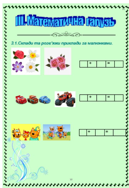
Рис. 5. Завдання з математики для учнів першого класу