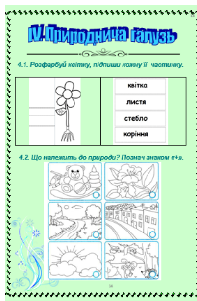
Рис. 6. Завдання з інтегрованого курсу «Я досліджую світ»