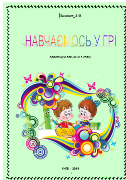
Рис. 3. Титульна сторінка авторського практикуму «Навчаємось у грі» для учнів першого класу

Практикум створено відповідно до Типової освітньої програми початкової освіти (за Р.Б. Шияном) для циклу І (1–2 класи). Він охоплює десять розділів, відповідно до освітніх галузей. Матеріали дібрано з урахуванням принципів доступності, інтеграції, системності, комплексності, гуманізації змісту розвитку, навчання і виховання учнів молодшого шкільного віку. Посібник містить багато яскравих ілюстрацій та завдань, де діти можуть самі роз-