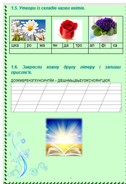
Рис. 4. Завдання з української мови для учнів першого класу