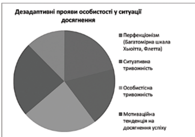
Рис. 1. Показники внеску предикторів у прогнозуванні динаміки дезадаптивних проявів особистості у ситуації досягнення

За результатами проведення корекційної програми виявлено позитивну динаміку зниження рівня деструктивних проявів перфекціонізму досліджуваних за показ-