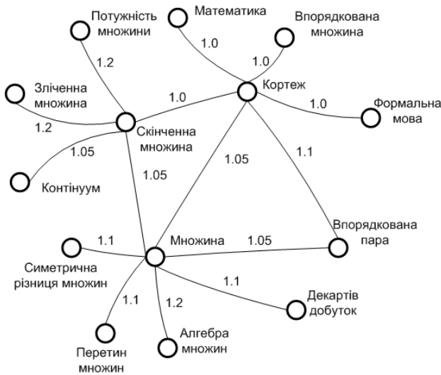
Рис. 8. Фрагмент асоціативних зв'язків сформованої онтології

ними, за деякими незначними винятками, в основному відповідають поняттєвій структурі предметних галузей. Тому якісний склад онтології та адекватність відношень можна вважати цілком прийнятними для використання в інформаційно-пошуковій діяльності.