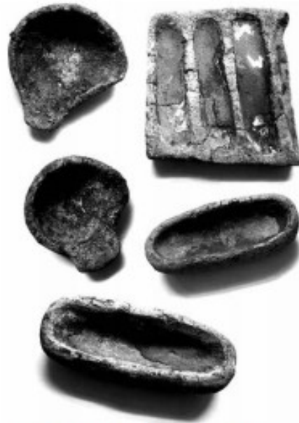
■ Набір форм та льячок із поховання ливарника, датованого першою половиною III тис. до н. е. на Херсонщині (катакомбна культура, розкопки А. І. Кубишева. Археологічний музей НАН України).

Ідея створення металевих грошей прийшла людям не одразу. Однак навчившись видобувати та обробляти метали, народи багатьох країн поступово стали використовувати метали як гроші. Причому метали виявилися настільки зручні для такого використання, що досить швидко витіснили більшість інших форм грошей.