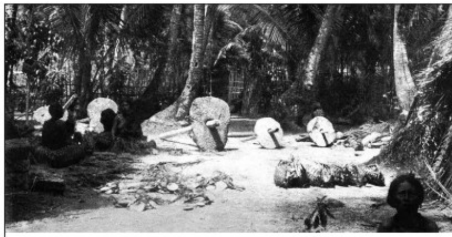
■ «Кам'яні гроші» перед житлом місцевих мешканців на одному з островів південної частини Тихого океану. Фото початку ХХ ст.

янки первісних людей, обсидіан вивозили іноді за кілька сотень кілометрів від тих місць, де його видобували. Те саме можна сказати і про інший матеріал, що зазвичай ішов на виготовлення первісних знарядь праці — кремій . Численні археологічні знахідки дають можливість з повною впевненістю стверджувати, що у прадавні часи саме кремій і обсидіан правили за своєрідну «тверду валюту» , що її можливо було вимінити на інші корисні речі — шкіри тварин, морські мушлі, прянощі, сіль і таке інше.