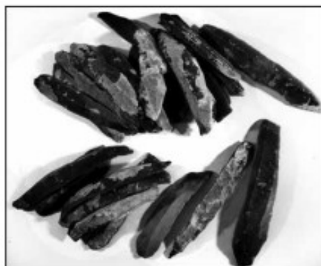
■ Скарб із кременевих пластин, Середнє Подніпров'я, трипільська культура, IV тис. до н. е. Кременеві пластини могли виконувати у кам'яному віці функції грошей. У цьому скарбі, знайденому у горщику, налічувалося 150 пластин, видобутих на Волині, за сотні кілометрів від берегів Дніпра.

Причому, як показують розкопані і досліджені археологами сто-