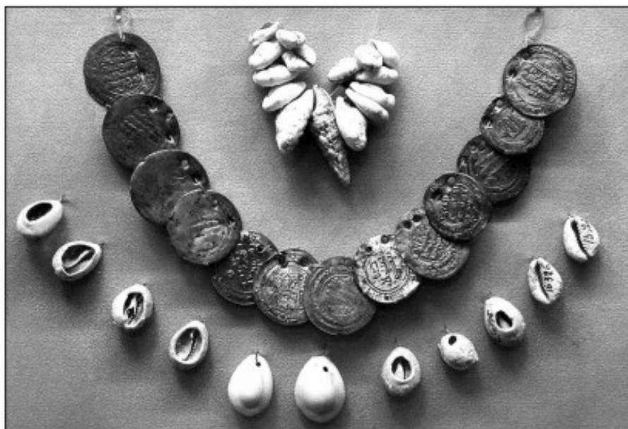
■ Упродовж кількох століть мушлі наурі поруч із срібними арабськими дирхемами були в обігу на землях Русі. На фото — знахідка з поховання X ст., дослідженого на Середньому Дніпрі. Експозиція Національного музею історії України.

Перевагою металів було те, що їх можна було легко ділити на частини, а потім знову переплавляти. До того ж, метали не боялися вогню і не псувалися від зберігання. Зберігати їх можна було практично вічно.