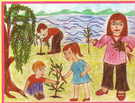
Зберігаємо і прикрашаємо Терсу. Максим Пінчук

Малюнки учнів 2 класу Східницької ЗОШ І–ІІІ ст. № 2 Бориславської міської ради Львівської обл. Вчитель – Галина Шийка.