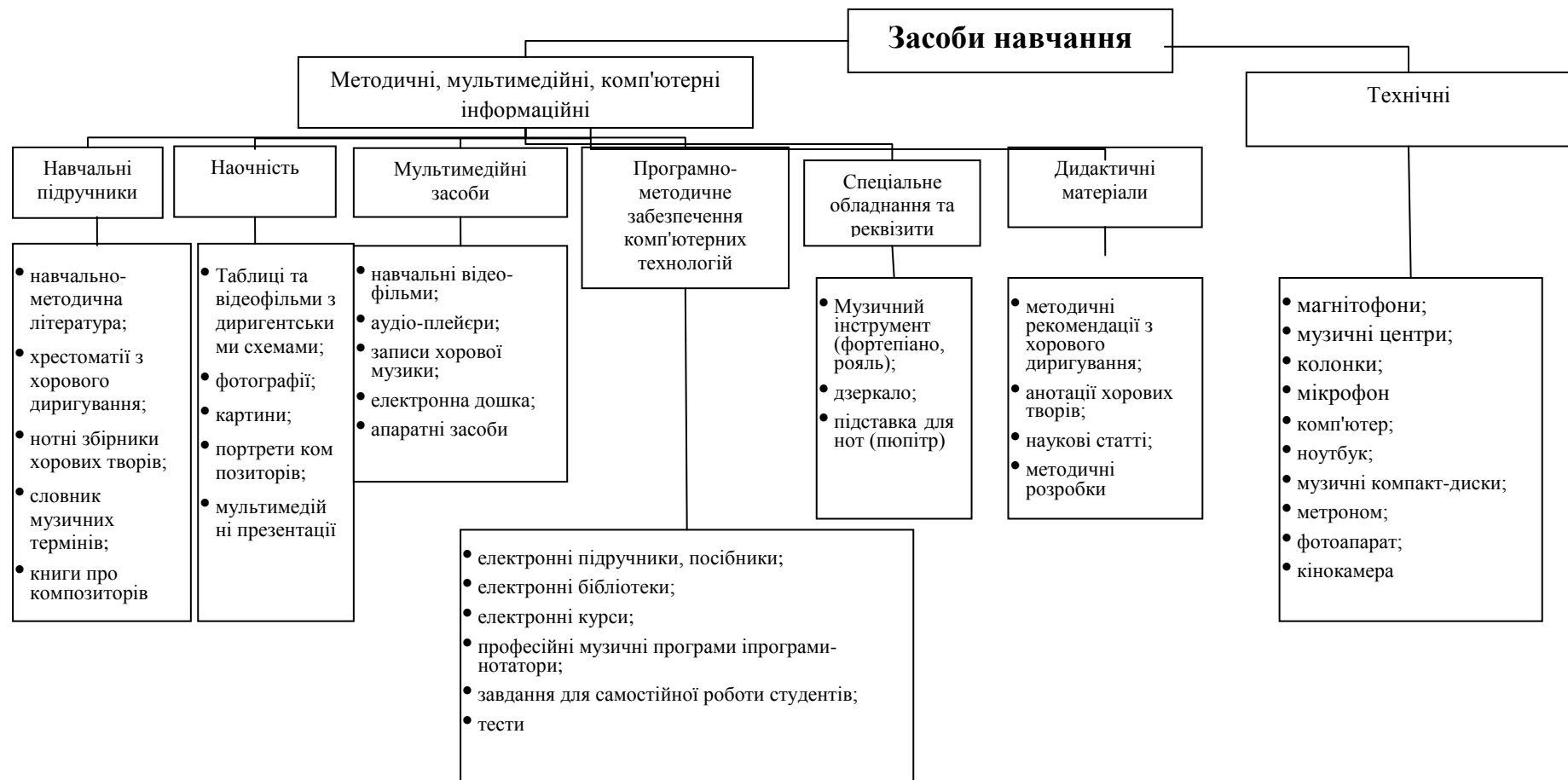
Рис. 3 – Класифікація сучасних засобів навчання з хорового диригування