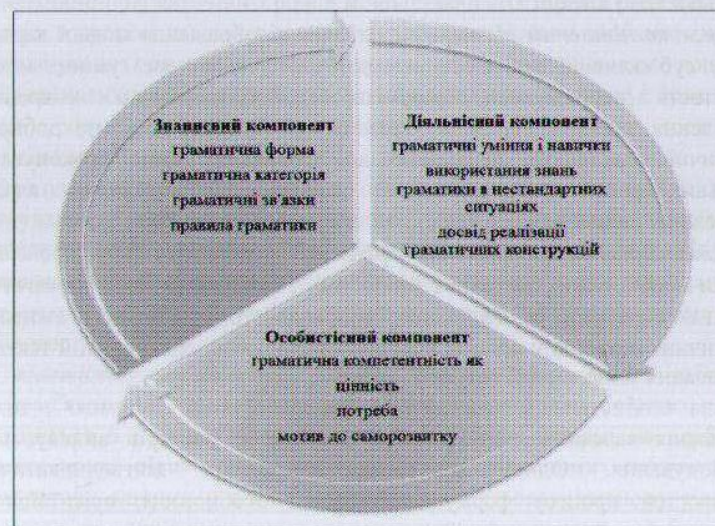
Рис. 3. Загальна структура граматичної компетентності

Ефективність впровадження компетентнісного підходу в освітньому процесі гальмується певною невідповідністю вчителя, що виявляється в недостатньому розумінні ним дидактичних і методичних аспектів моделювання уроків, на яких має відбуватися системне й цілеспрямоване формування в учнів предметних і ключових компетентностей. Зокрема, у контексті Нової української школи провідною стає необхідність у підготовці грамотної людини з належним рівнем лінгвістичної компетентності, що