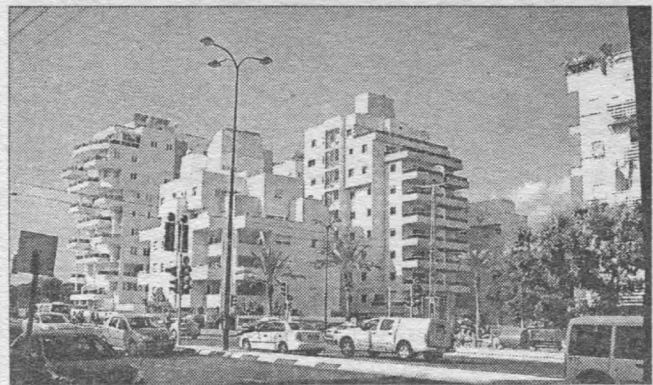
■ Престижний житловий комплекс міста Нетанія

Житлове будівництво становить 75 % всього будівництва в країні.