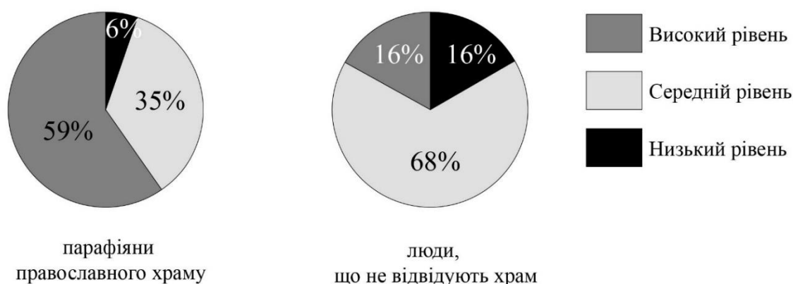
Рис. 2. Рівні сформованості духовних цінностей у представників групи «прихожан» та «світської» групи (%)

У людей другої групи («світської») спостерігається інша ієрархія цінностей. Найбільш вираженими є соціальні цінності, на другому місці перебувають духовні, на третьому – сімейні і на останньому – егоцентричні. Найбільш різючі відмінності полягають у рейтингових місцях, які представники цих груп присвоюються духовним (перша група («парафіяни») – 24, друга («світська» група – 33) та егоцентричним цінностям (перша група – 38, друга – 46). Отримані результати дозволяють зробити висновок про пріоритетність духовних цінностей у людей, які є парафіянами храму та здійснюють духовні практики. Більш детальний аналіз рівня сформованості духовних цінностей у представників цих груп дозволяє зробити висновки, що серед представників першої групи 59 % осіб – з високим рівнем сформованості духовних цінностей (коли серед представників другої групи лише 16 %), з низьким – 6 %, тоді, коли у другій групі таких осіб 16 % (див. рис. 2).