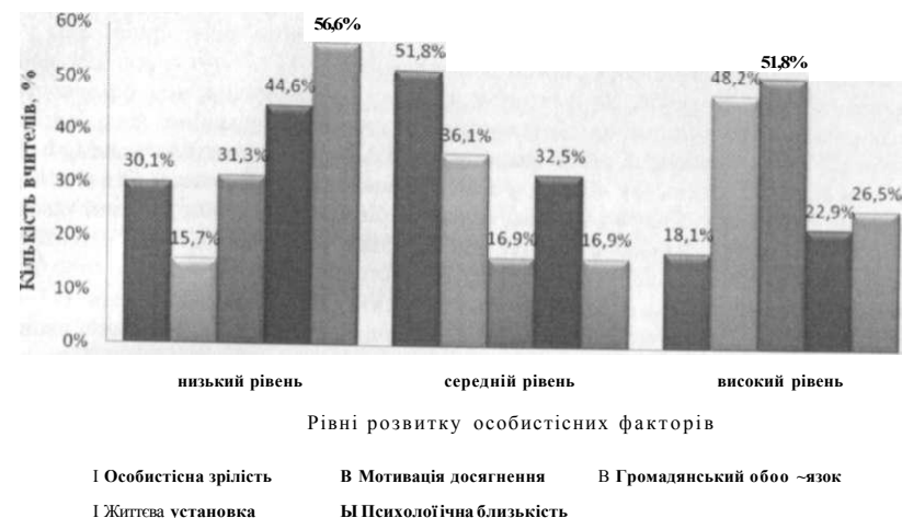
Рис. 2. Представленість розвитку особистісних факторів у вчителів, які працюють за інноваційних умов

За такими факторами як особистісна зрілість ( p < 0,0001 ), мотивація досягнення ( p = 0,003 ; p < 0,01 ), громадянський обов'язок ( p < 0,01 ), психологічна близькість ( p < 0,05 ), відповідальність за власне здоров'я ( p < 0,001 ), відповідальність за сімейні взаємовідносини ( p < 0,001 ) з'ясовані відмінності на високих рівнях статистичної значущості в результаті аналізу за непараметричним критерієм Манна-Уїтні.