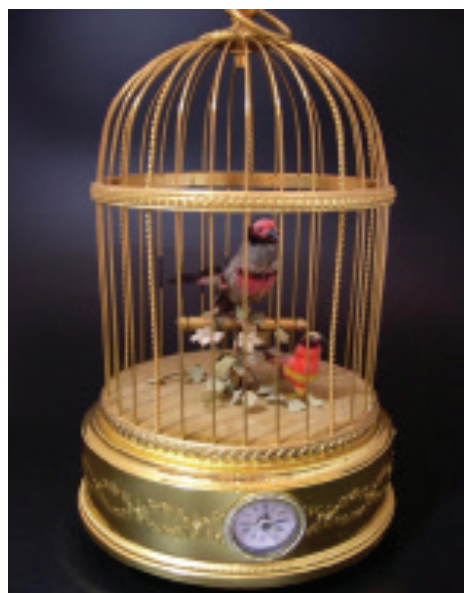
Музична скринька-годинник. Reuge Music

Отже, з'явившись наприкінці ХІХ ст. як форма супротиву буржуазним нормам моралі та застою старих традицій у мистецтві, у ХХІ ст. новітній декаданс більше не знаменує занепад, не являє собою явище, яке охоплює культуру загалом, а радше є стилізацією. Відобразившись у легковажному гламурі, як сучасній формі естетизму, він привніс до його китчевості й епатажу риси елегантності та вишуканості, а також надав присмак драматизму і меланхолії.