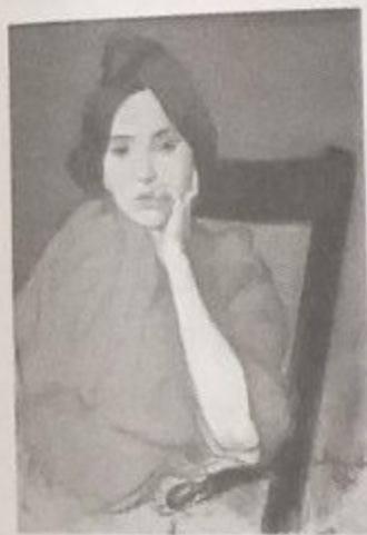
«Портрет жінки» Луї Анкетен. 1890 р.