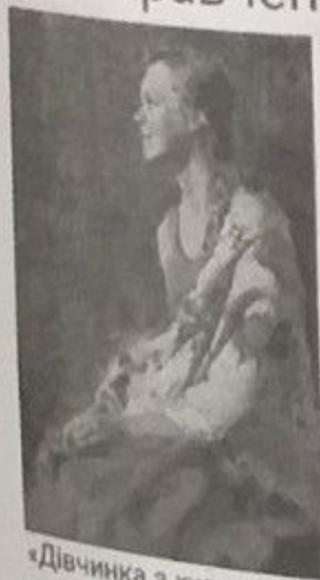
«Дівчинка з хустинкою» Кирилов Володимир.