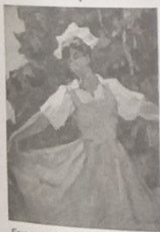
Етюд. А.І. Плотнов. Картон, масло. Банківський краєзнавчий музей