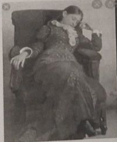
Ілля Рєпін «Відпочинок» 1882 р.