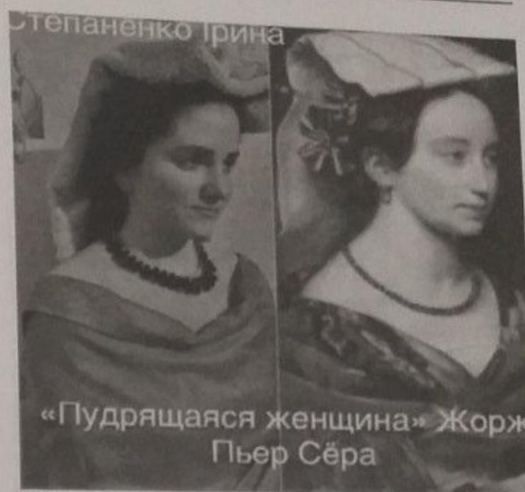
«Пудрящаяся женщина» Жорж Пьер Сёра