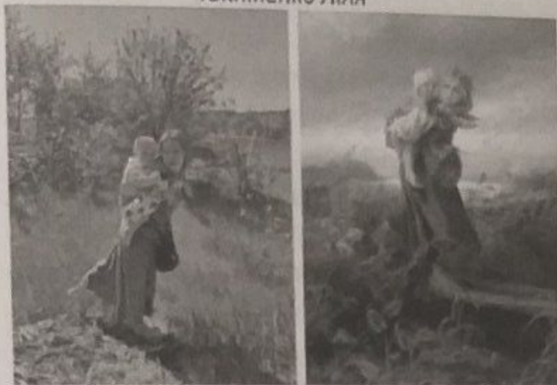
«Діти біжать від грози» Маковський Константин Єгорович 1872р.