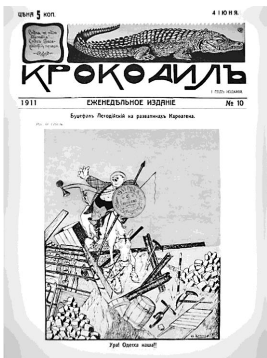
Рис. 5. Обкладинка видання «Крокодил» (1911 р.)

«Крокодил» щотижневик (1911–1912 рр.), видавець Б. Фліт (псевдонім «Незнакомец»). Журнал дотримувався демократичного спрямування. Художники «Крокодила» не скупилися на критику та висміювання міської влади, бюрократії, хабарництва, особливостей «одеської мови», пияцтву, незмінному репертуару театрів тощо. Також у журналі піднімалися питання антисемітизму.