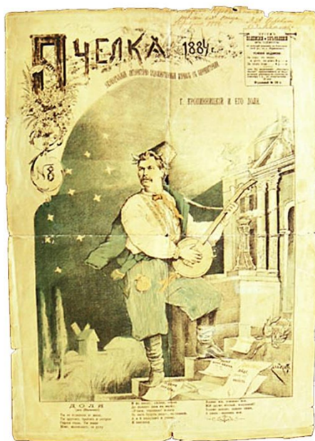
Рис. 3. Обкладинка видання «Пчелка» (1884 р.)