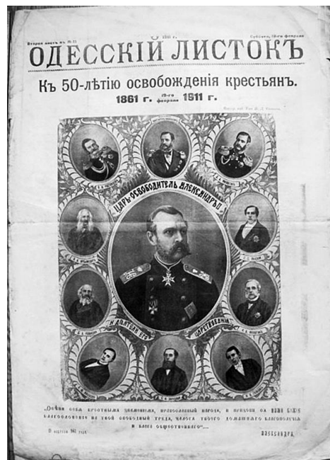
Рис. 4. Обкладинка видання «Одесский листокъ» (1911 р.)

Розуміння розвитку сатиричного видання в часі демонструє приклад додатків до «Одесского листка» (рис. 4) та «Одесских новостей», що виходять у 1905 році. Науковець Є. Демченко характеризує сатиричний додаток до газет як журнал з 4–