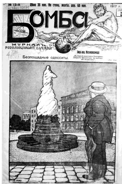
Рис. 6. Обкладинка видання «Бомба» (1917 р.)

Логотипом журналу слугував графічний малюнок крокодила, що розміщувався у верхній частині обкладинки. Зліва від логотипу був штамп, а знизу назва «Крокодилъ», що виконана рубленим шрифтом із «комічно» деформованими літерами. Під назвою надано вихідні дані.