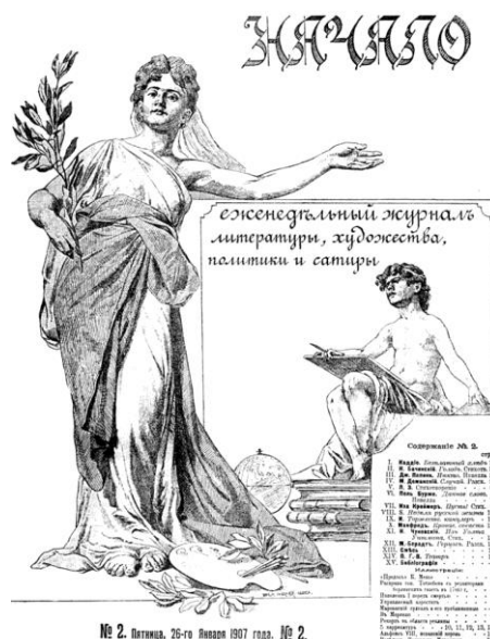
Рис. 2. Обкладинка видання «Начало» (1907 р.)