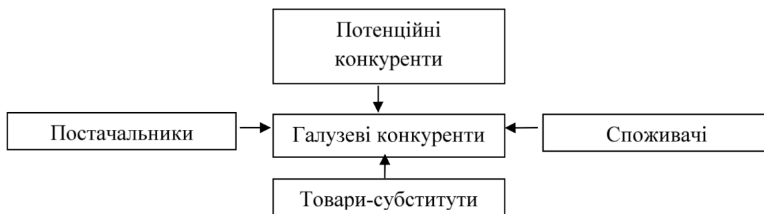
Рис.1 Модель п'яти конкурентних сил М. Потера

Професор визначає конкурентне середовище як сукупність організацій-суперників, які бажають досягти своїх цілей будь-якими засобами в мінливих умовах. Майкл Портер передбачає залежність рівня конкуренції від 5 складових: загрози появи продуктів-замінників; загрози появи нових гравців; ринкової влади постачальників; ринкової влади споживачів; рівня конкурентної боротьби [1, С. 36]. Вони відображені на рис. 1.