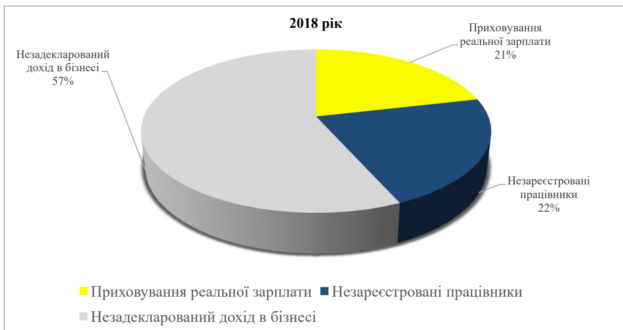
Рис. 1. Складові тіньової економіки в результаті ухиляння від сплати податків в Україні (%) (складено авторами на основі джерела 4)