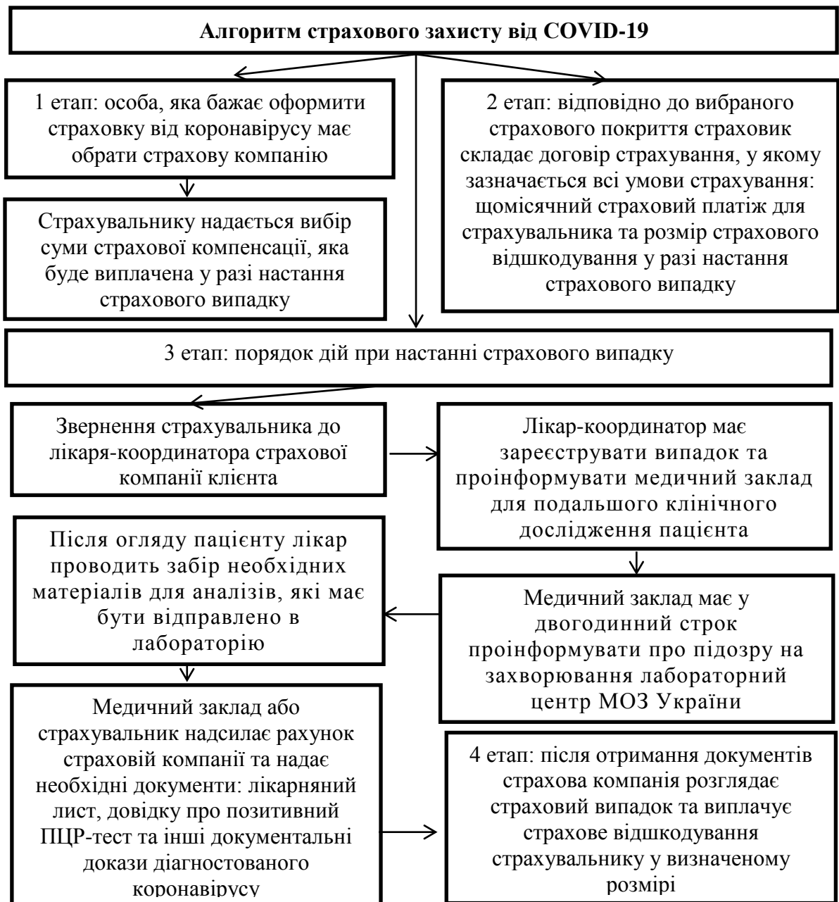
Рис. 3 Алгоритм надання страхового захисту від COVID-19