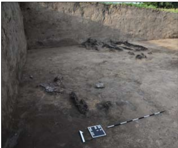
Рис. 2. Скупчення розвалів посуду і шматки обгорілого дерева в насипі кургану 6 зі Слободи Носковецької