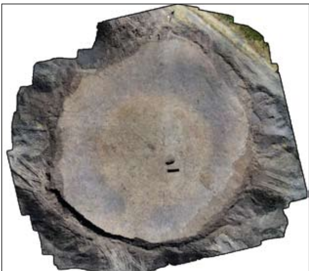
Рис. 3. Ортотрансформоване фото плану на глибині 60 см кургану 3 з групи Іванівці–Антонівка (автор М. Подсядло)

Досліджений курган 6 зі Слободи Носковецької був найбільшим у групі. Його діаметр становив 35 м, а висота, зважаючи на розташування на похилій ділянці, 1,8–2,2 м. Курган був одноактною спорудою, оточений кільцевим ровом 3–5 м завширшки і 0,2–0,4 м завглибшки від рівня давньої поверхні.