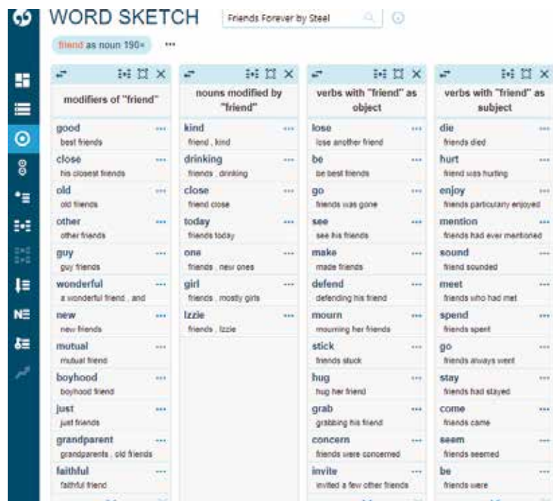
Figure 3. The word sketch of friend in D. Steel's