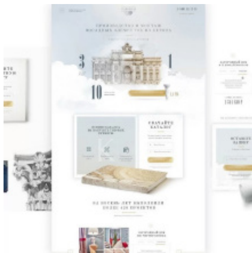
Рис. 3 Приклад дизайну сайту в ретро стилі

текстури, півтони, які немов вигоріли на сонці або потьмяніли під впливом часу. Відповідно, використовують шрифти від справжніх готичних до майстерно стилізованих під минулі епохи. Кольорова палітра пастельна та стримана, використовується ч/б та сепія. Такий стиль сайту підходить для творчих людей, продавців антикваріату, букіністів, а також тим, чий бізнес є сімейною справою і який має багатолітню історію.