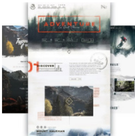
Рис. 2. Приклад сайтів в стилі грандж

Для стилю грандж (Рис. 2) характерними є розмиті, нечіткі лінії, потертості, неохайні, потерті текстурні фони, відчувається брутальність та епатажність. Цей стиль є творчим, часто використовує темні, натуралістичні відтінки кольорів, є елементи естетики урбанізму та елементи «hand-made». Використовуються гротескні шрифти з ефектами потертості, розмитості, неохайності та інше. Те саме стосується і текстур, які імітують камінь, графіті, тканину денім, бумагу та інше. Цільовою аудиторією є ті, хто цінує крафтове ремесло. Така естетика орієнтується в першу чергу на молодь.