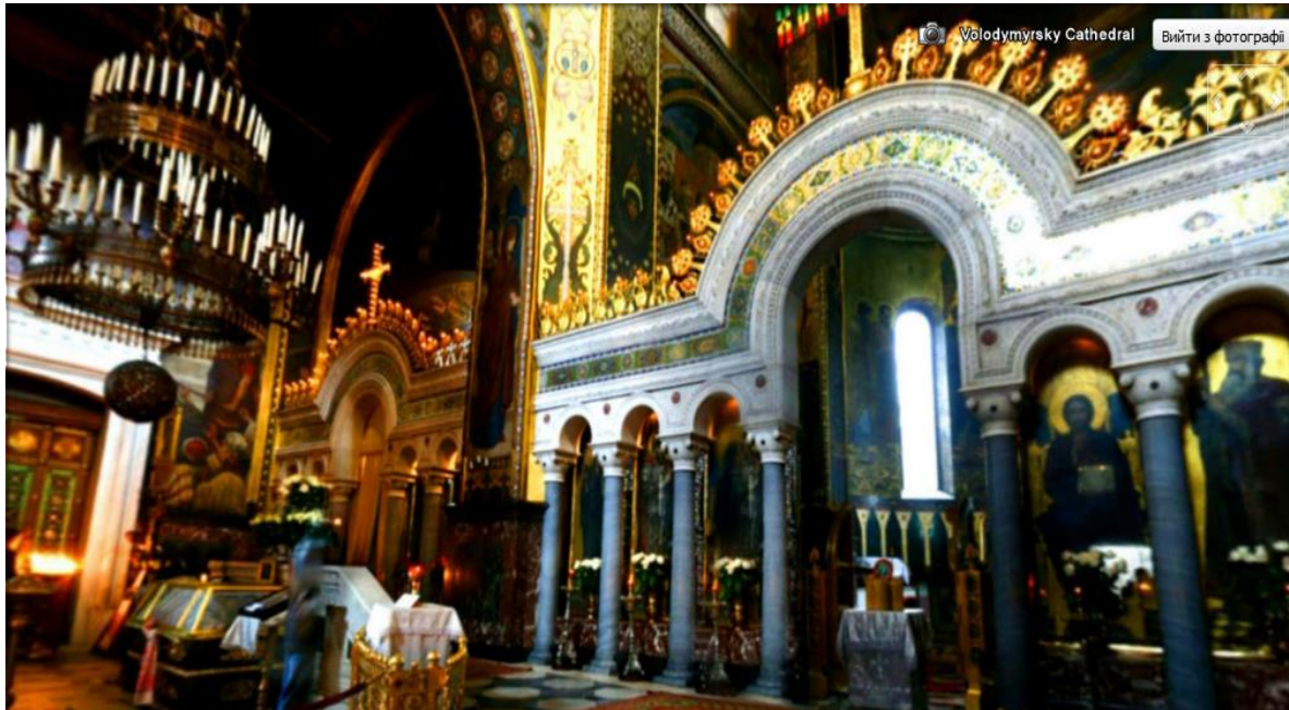
Рис.2 Внутрішнє оздоблення Володимирського собору (Київ, Україна) у режимі 360 Cities «Google Планета Земля»

Наприклад, майбутнім менеджерам туризму пропонується виконати таке завдання. Використовуючи компонент «переміститися до» послуги «Пошук» знайти на карті Володимирський собор у Києві та переглянути його фотографії. Користуючись компасом одержати зображення собору з усіх сторін та зверху. Використовуючи мітку 360 Cities , переглянути внутрішнє оздоблення собору. (рис.2)