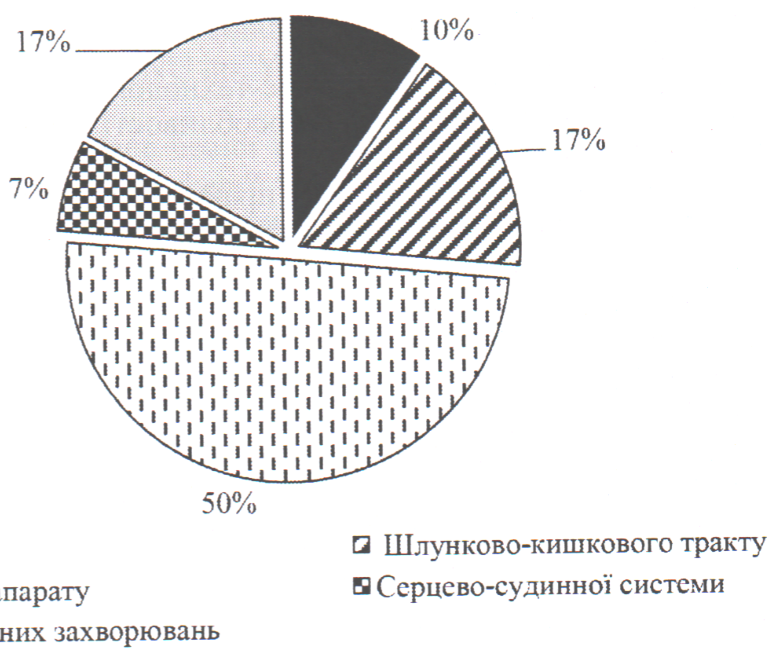
Рис. 3. Співвідношення (%) щодо наявності хронічних захворювань у респондентів ( n = 40 )