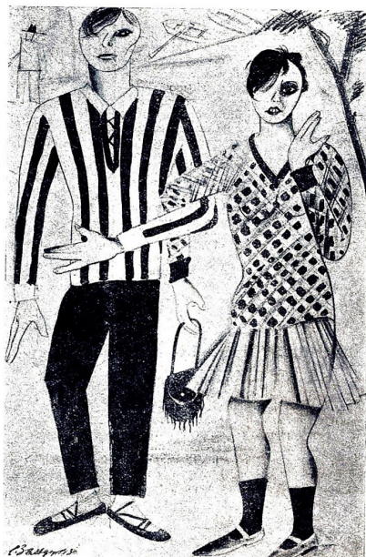
Вона: — Ти відмовився їхати на село? І справедливо, там же така темрява: ні оперети, ні джаз-банду...