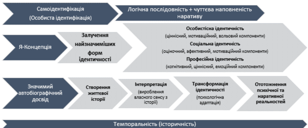
Рисунок 2. Авторська модель наративної ідентичності операторів служби підтримки.

Тому, досліджуючи вплив пандемії на можливі зміни в наративній ідентичності операторів служби підтримки, в нас виникла необхідність створення моделі наративної ідентичності операторів служби підтримки. На рис. 2 представлено схематичне зображення авторської моделі: