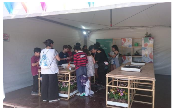
Рисунок 4. Освітні еко-програми для молоді на літніх Юнацьких Олімпійських іграх у 2018 р. (Буенос-Айрес, Аргентина)

Також важливу роль у формуванні екологічного світогляду молоді відіграє участь у Всеукраїнському спортивно-масовому заході серед дітей «Олімпійське лелечення», яке щороку проводить НОК України, починаючи з 2011 р. Захід спрямований на реалізацію одного із важливих напрямів діяльності Міжнародного олімпійського комітету – заохотити дітей та молодь у всьому світі