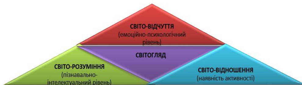
Рисунок 2. Світогляд особистості (за В. Шинкарук [15])

ціннісні орієнтації (рис. 2). Тож, І. Надольний [5], І. Хайрулліна [16] аналізують світогляд як систему поглядів, яка визначає загальну спрямованість діяльності і поведінки людини та є найвищим синтезом знань, практичного досвіду та емоційних оцінок.