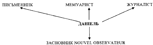
Рис. 2. Схема асоціативних концептів концепту ДАНИЕЛЬ

Концепт ДАНИЕЛЬ має такий вигляд (див. рис. 2):