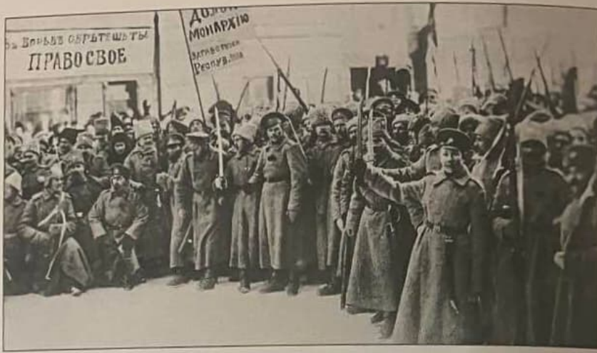
Рис. 7.1.4. Мітинг проти імператора в Петрограді

Особливо збурилося суспільство в Російській імперії, де поразки, великі військові втрати, розвал економіки, злидні й голод налаштували проти влади найширші верстви населення. В лютому 1917 р. антивоєнні та соціальні виступи в Росії переросли в революцію (Рис. 7.1.4 1 ). Імператор Микола II зрікся престолу й самодержав-