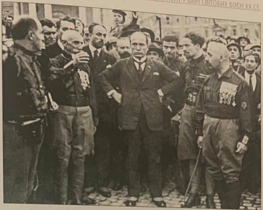
Рис. 7.2.1. Беніто Муссоліні серед однопартійців

1929 р. в Німеччині завершився «золотий час» Веймарської республіки. Німецьке суспільство, його повсякденне життя і економіка відчували на собі всі найжахливіші наслідки Першої світової війни. З 1929 по 1932 рр. промислове виробництво впало на 40%, а сільськогосподарське — на понад 30%. Рівень безробіття досягнув європейського рекорду — 9 млн. чол. На тлі загальної кризи почалося гостре протистояння двох крайніх