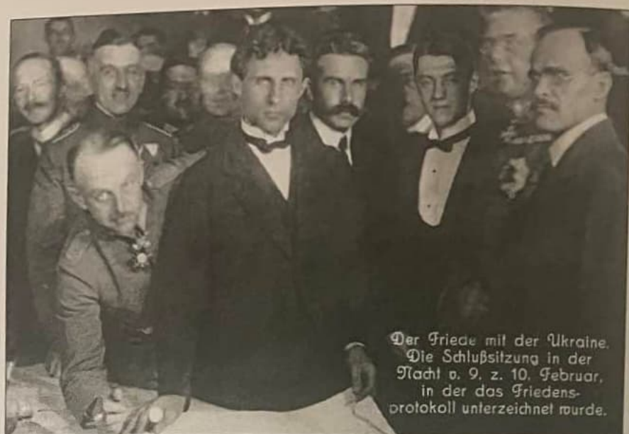
Рис. 7.1.5. Підписання Берестейського мирного договору 8–9 лютого 1918 р.