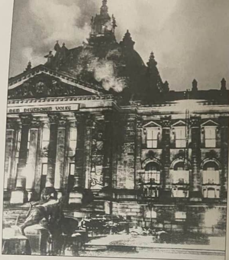
Рис. 7.2.2. Пожежа будівлі Рейхстагу 27 лютого 1933 р.