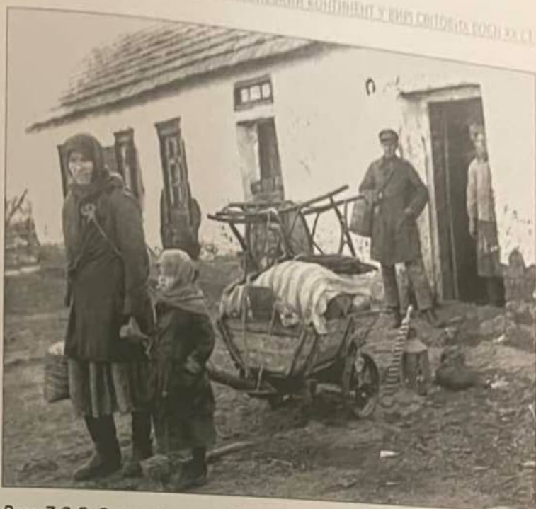
Рис. 7.2.5. Розкуркулена сім'я біля свого будинку в с. Удачне Донецької обл. 1930-ті рр.

Отже, реаліями суспільно-політичного життя Європи середини ХХ ст. стали тоталітарні й авторитарні режими різних типів, які показали свою життєздатність за економічних, політичних, національно-історичних та соціокультурних обставин того часу.