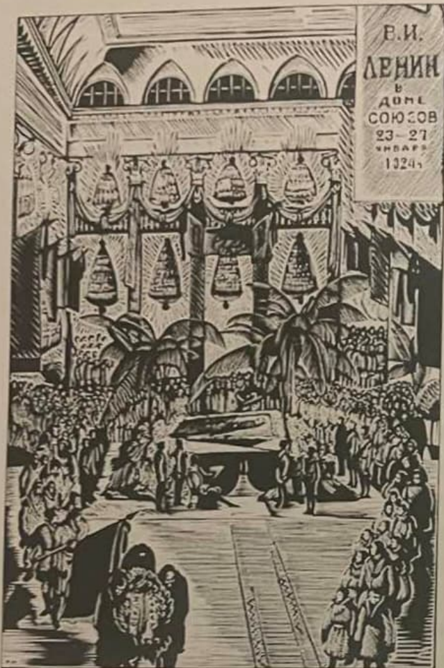
Рис. 7.2.4. Кравченко О. І. Похорон В. І. Леніна (Ксилографія, 1927 р.)

тьох відомих компаній світу («Siemens», «General Electric», тощо). 1930 р. було розгорнуто будівництво близько 1500 об'єктів, серед яких ДніпроГЕС і Харківський тракторний завод.