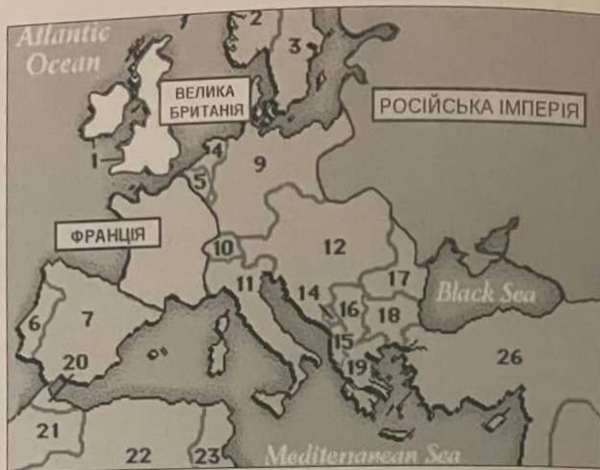
Рис. 7.1.2. Антанта (1904–1907 рр.)

в складі російської армії перебувало 3,5 млн. українців, Австро-Угорської – 250 тис. Війна зумовила глибокий розкол українського національного руху. Товариство українських поступовців (ТУП) у Наддніпрянщині, утворене 1908 р. як міжпартійний блок, обстоювало позицію, за якою українці мали захищати Російську державу. Частина членів УСДРП на чолі з С. Петлюрою закликала до того самого, а решта на чолі з В. Винниченком проголошувала: «Геть війну!», «Хай живе автономна Україна!». На початку війни емігранти-москвофіли Західної України утворили в Києві «Карпато-Руський визвольний комітет», що закликав галичан зустрічати російську армію як визволительку.