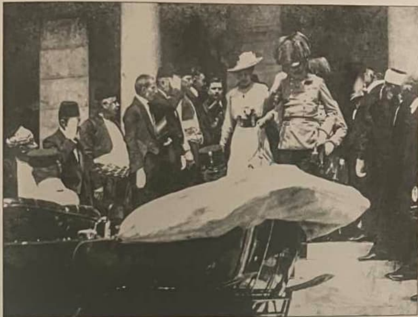
Рис. 7.1.1. Ерцгерцог Франц Фердинанд та герцогиня Софія Гогенберг на сходах Ратуші в Сараєво

Перша Світова війна стала тотальною й за демографічними втратами значно перевершила всі попередні найбільші воєнні зіткнення. В Західній Європі вона зберегла значення коду історичної пам'яті навіть після ще кривавішої Другої Світової війни. Понад те, Першу Світову визнали однією з ключових передумов Другої. У самій же Великій війні віддзеркалилися суперечності між європейськими державами та давні внутрішні проблеми в них.