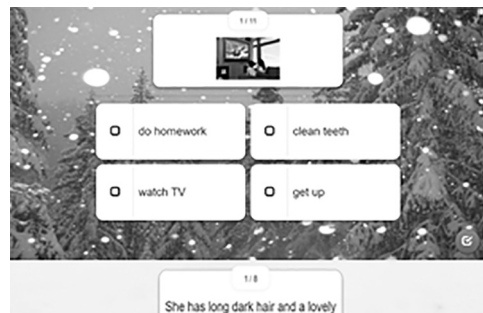
Рис. 3. Фрагмент завдання з формування лексичної компетентності

Приклади інтерактивних вправ з англійської мови у Web-сервісі LearningApps.org для формування іншомовної мовленнєвої діяльності дітей 6-7 років. Для того, щоб формувати лексичні навички, в рамках первинної презентації слова слід запропонувати дітям завдання типу вікторини на вибір правильних відповідей (Multiple-choice) (Рис. 3).