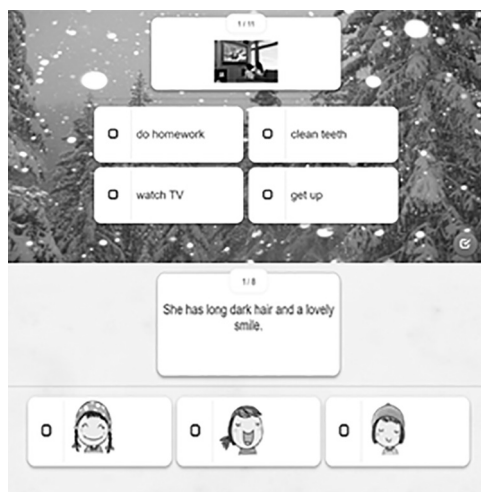
Рис. 4. Фрагменти завдань з формування граматичної компетентності

При формуванні граматичних навичок в рамках теми «Parts of body. Appearance» і автоматизації способу дії з переведення пропозицій з української мови на англійську актуальними будуть завдання на вибір правильної відповіді (Рис. 4).