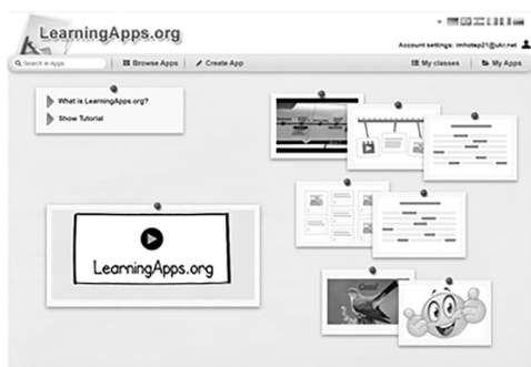
Рис. 1. Загальний вигляд Web-сторінки LearningApps.org

LearningApps.org є безкоштовним Web-сервісом інтерактивних завдань і вправ, які можна розробляти як самостійно, так і використовувати вже розроблений іншими користувачами контент в різних формах організації навчальної і самостійної діяльності на різних етапах занять з англійської мови (закріплення, перевірки та узагальнених набутих знань, умінь та навичок дітей старшого дошкільного віку) (Pisc. 1) (Gunter G., Campbell L., Braga J., Racilan M., V. Souza, 2016; Волубаева В., 2017, с. 40).