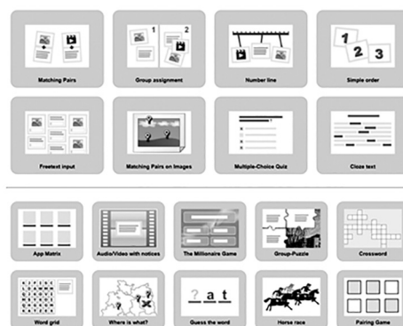
Рис. 2. Перелік доступних шаблонів на сервісі

Всі представлені завдання згруповані для дітей за функціональною ознакою (Multiple-choice, Sequence або Pairing, Order, Filling in, Group Puzzle, Crossword, Word grid, Patring Game та ін.) (Pisc. 2) і вирішують ряд дидактичних завдань: активізує словник дітей, формує навички та вміння читання, удосконалює вміння писемного мовлення дітей, розвиває елементарні мовленнєві навички: аудіювання, говоріння, слугує вправлянням дітей щодо вживання граматичних форм, стимулює дитяче словотворення. Доцільним є також використання сервісу, як ілюстративного засобу, а також засобу оцінки знань, при навчанні аудіювання, а також у проектній діяльності (Мельник О., 2011, с. 17; Solomakha A., Kosharna N., 2020, с. 111).