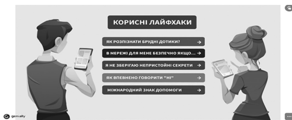
Рис. 4. Скрін вигляду «Корисних лайфхаків».

Важливим компонентом кожного онлайн заняття є «Корисні лайфхаки» (Рис. 4.). Саме лайфхаки (сленговий термін), тобто практичні підказки, які діти завантажують на власні мобільні пристрої, допоможуть їм, при потребі. Корисні лайфхаки представлені у вигляді інтерактивної презентації, розробленої за допомогою онлайн інструменту Genially.