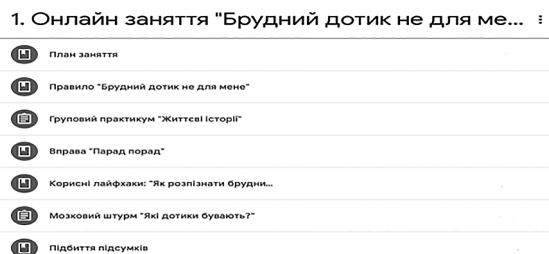
Рис. 2. Скрін вигляду онлайн заняття «Брудний дотик не для мене» на платформі G-class.

Віртуальні зустрічі учасників цих занять відбуваються у режимі реального часу із використанням спеціальних платформ для віртуальної комунікації, як то ZOOM, Google Meet, Blue Jeans або інших, які можуть забезпечити відео- та аудіотрансляцію всіх учасників, а також функції чату, передачі документів, таблиць, презентацій, фотографій, інших файлів, відеовідображення робочого столу тощо. Для комфортного користування курсом обрано простий та зрозумілий формат структури заняття, де кожен елемент зручний у користуванні (Рис.2.).