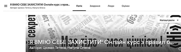
Рис. 1. Скрін вигляду онлайн курсу на платформі G-class

Авторський онлайн курс «Я вмію себе захистити» є електронним методичним посібником для роботи з дітьми, розміщеним на мережевому, віртуальному майданчику (Рис.1).