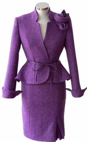
Ил. 1. Костюм «Харрис», «Huntsman», 2013г.

«Huntsman» – одна из немногих компаний на Сэвил Роу, имеющая долгую историю производства «bespoke» для леди. Эти архивы охватывают более 100 лет и включают такие имена, как Гертруда Лоуренс, Адель Астер, Кетрин Хепберн и Элизабет Тейлор. Многие женщины удовлетворяли в компании свои потребности в элегантной одежде для верховой езды, заказывали брюки-галифе а так же смокинги. Сегодня портфолио дома демонстрирует масштаб и широту стиля: команда создает как изысканные и уникальные предметы формальной одежды, так и экстравагантные вечерние туалеты [6]. Одежда создается с учетом особенностей внешности женщины, имеет мягкие линии, отличается особым вниманием к деталям, сложной обработкой и декорированием и изготавливается исключительно из высококачественных тканей, начиная от традиционной камвольной до текстурированных твида, жаккарда, кашемира и шелка (Ил.1). В качестве дополнения к женскому костюму фирма производит шелковые блузы и классические рубашки со швейцарского и итальянского хлопка.