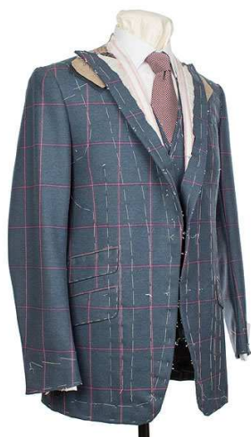
Ил.4. Мужской пиджак в промежуточной стадии пошива «bespoke». «Dege & Skinner», 2013г.