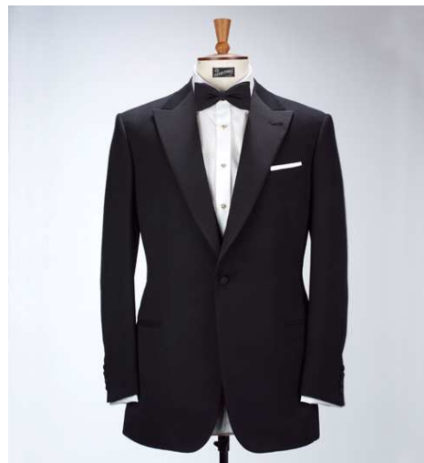
Ил.6. Современный вариант смокинга от «Henry Poole & Co», 2013 г.

Э. Роуланд, говоря о происхождении форм классического костюма, прежде всего указывает на их прототип – армейские униформы. Славное прошлое ателье стало не только историей, которой можно гордиться, но и фундаментом современного стиля. Весь процесс включает три примерки и больше чем 60 часов работы мужских и женских рук (от 1 до 12 недель). Каждый костюм изготавливается в мастерских №15 и 16 Сэвил Роу независимо от того, то ли это костюм для Букингемского дворца, для члена королевской семьи, либо костюм-тройка в «черчилльскую» тонкую полосу, предназначенный для зала заседаний совета директоров, или фрак для банкета в Мэншн Хаус, резиденции лорд-мэра.