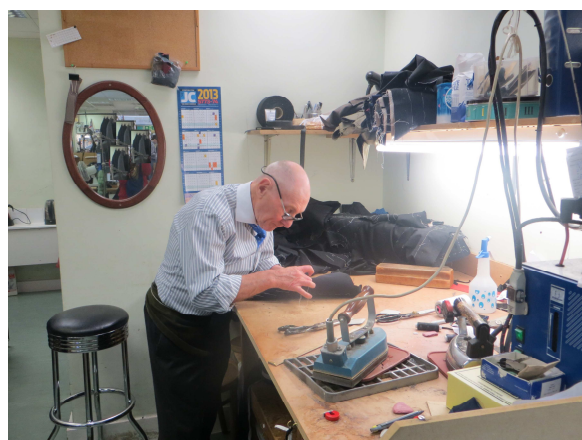
Ил.7. Портной мастерской «Henry Poole & Co» за работой. Март, 2013 г.