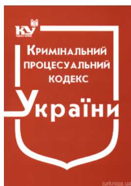
Кримінальний процесуальний кодекс України