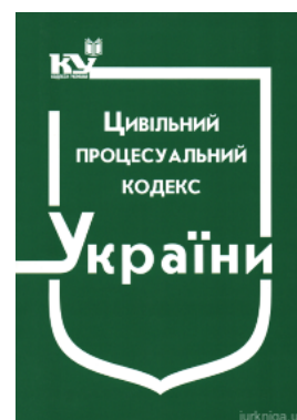
Цивільний процесуальний кодекс України