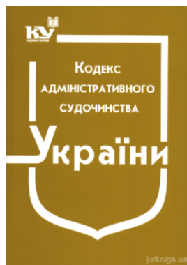
Кодекс адміністративного судочинства України