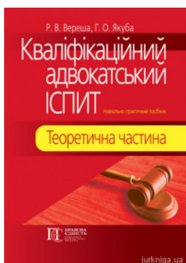
Кваліфікаційний адвокатський іспит. Теоретична частина