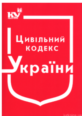
Цивільний Кодекс України