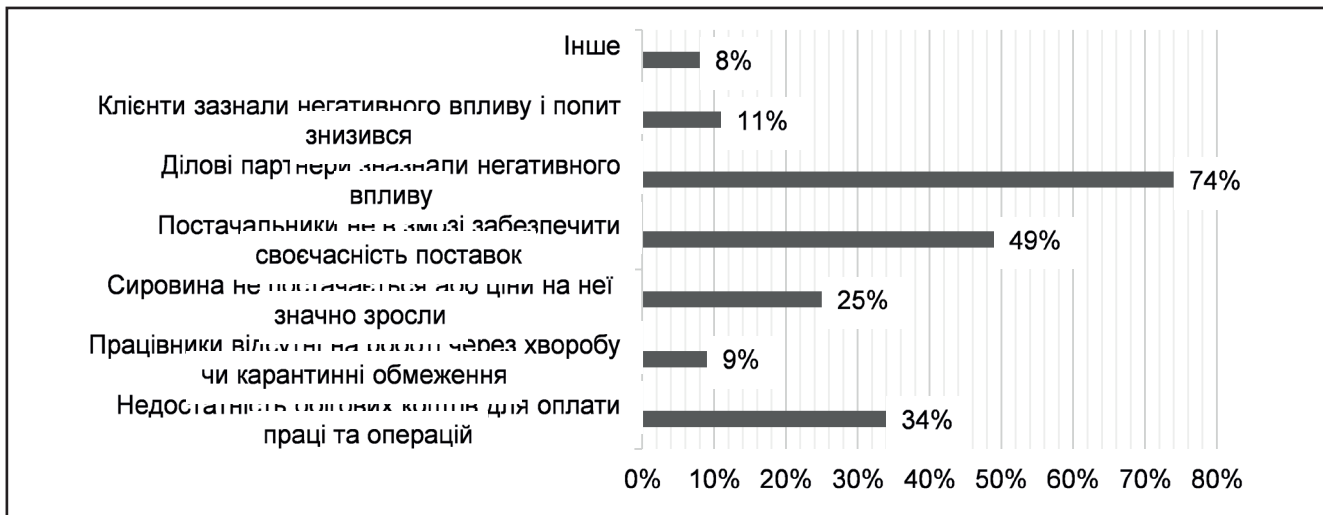
Рисунок 3. Основні проблеми діяльності у сфері бізнесу при пандемії у 2020 році