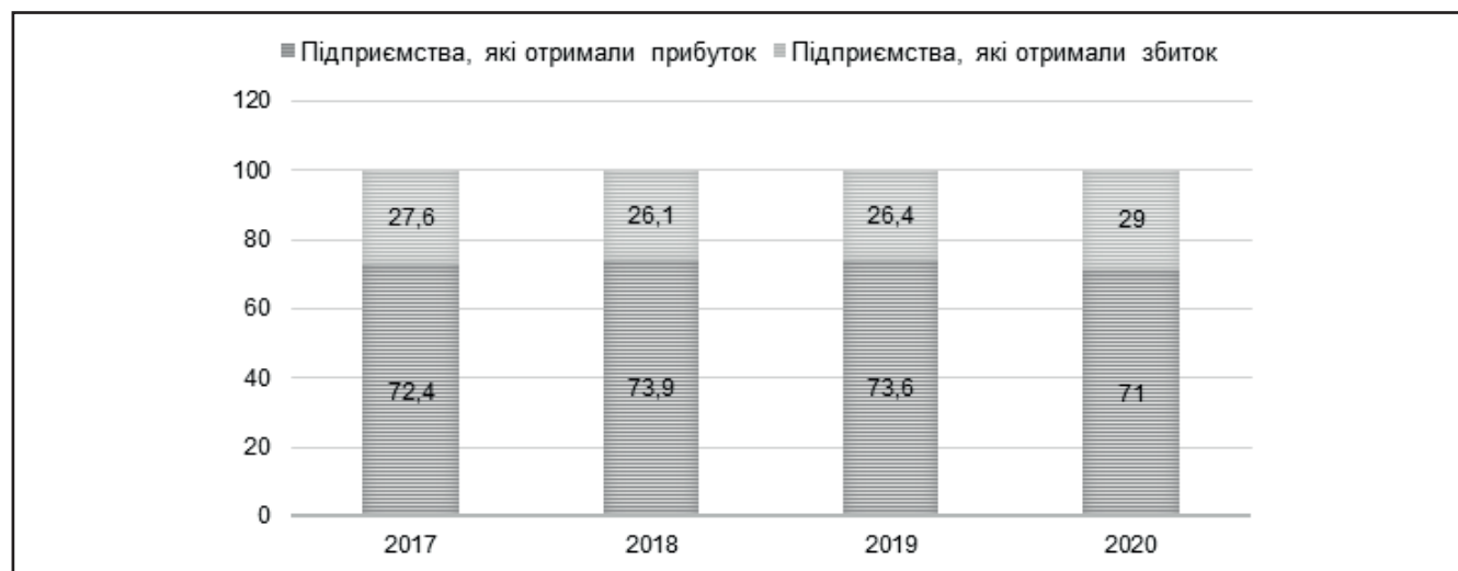
Рисунок 1. Структура підприємств України за фактом отримання чистого прибутку станом на 2017–2020 рр., %