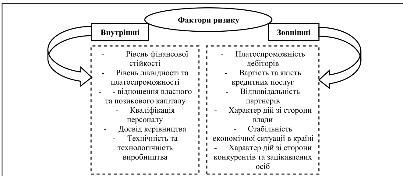
Рисунок 4. Фактори ризику фінансово-економічної безпеці бізнесу під впливом Covid-19