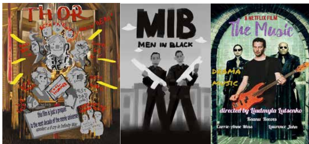
Рис. 4. Приклад виконання студентами завдання з рерайтингу фільму в іншому жанрі

ція очно-дистанційного навчання на практичних заняттях з іноземної мови та експериментальній перевірці впливу СМ на підвищення