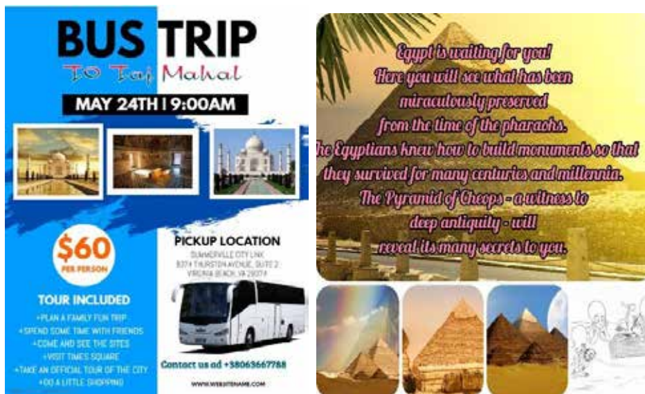
Рис. 3. Приклад розробки студентами інформаційного банеру