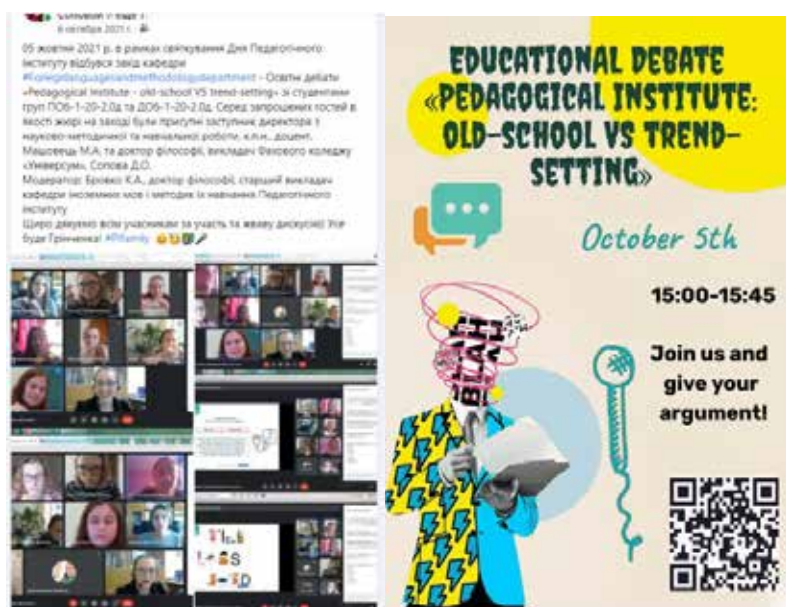
Рис. 2. Приклад проведення освітніх дебатів у СМ Facebook

Перспективи подальших наукових розвідок полягають у вивченні особливостей застосування СМ у освітньому процесі як однієї з технологій дистанційного навчання, апроба-