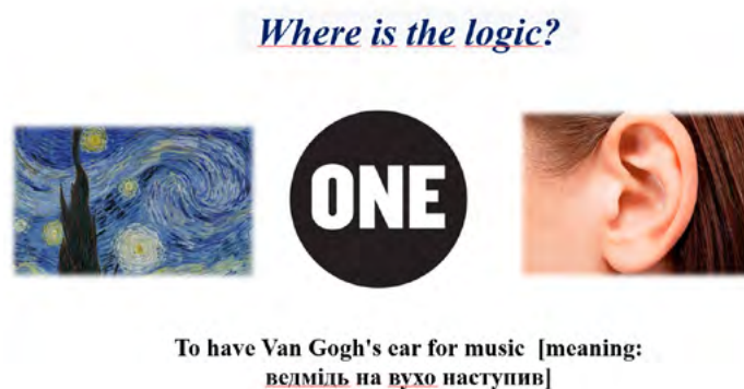
Рис. 3. Приклад завдання до проведення гри "Where is the logic?" (авторська розробка Бровко К.А.)

Окрім того, цікавим буде використання сервісів Slides, Prezi, Bubble.us та Pinterest з метою створення онлайн-колажів англійських ідіом (рис. 3).