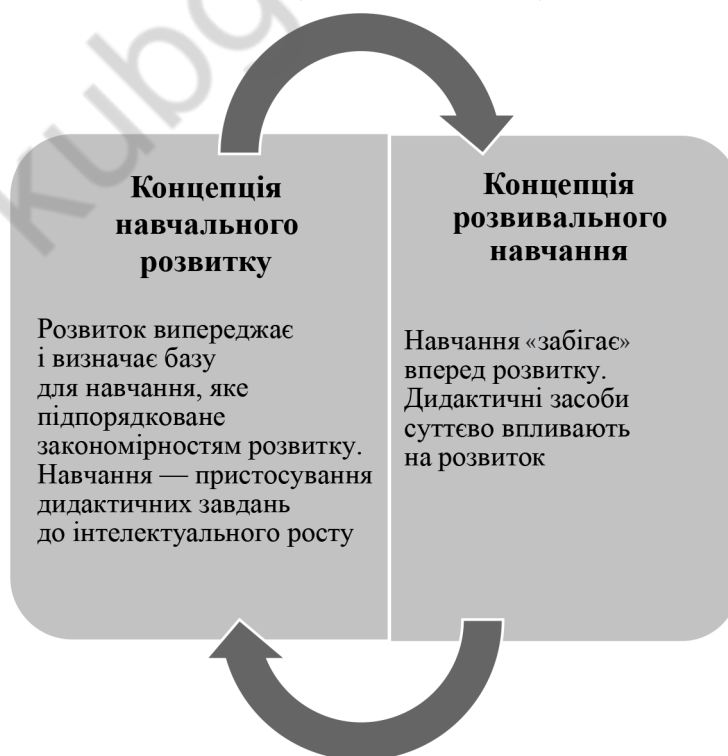
Рис. 2. Умовна схема співвідношення навчання та розвитку

Крім того, вчитель має закладати духовно-моральні та художньо-естетичні основи особистості дитини, стати першим провідником дітей у світ мистецтва. Сучасна музична педагогіка володіє широким потенціалом розвитку, навчання та виховання дитини. Музика супроводжує малюка весь час, однак потік музичної інформації часто не контролюється та не усвідомлюється. Музика, оминаючи свідомість, безпосередньо впливає на підсвідомі процеси, на психіку та соматіку дитини.