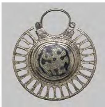
Rys. 1. Kolt srebrny tarczowaty z czernieniem z XI–XII wieku Ruś Kijowska. Metropolitan Museum of Art, Nowy Jork, USA.

Mitologiczne stworzenia książęcego Kijowa są nadal silnym źródłem inspiracji dla twórczości współczesnych ukraińskich artystów plastyków oraz mistrzów sztuki zdobniczej. Ten proces naśladowania tradycji przodków jest nadzwyczajnie ważny dla odrodzenia kultury, samoidentyfikacji, ukształtowania świadomości narodowej, a w końcu zwycięstwa w wojnie, która toczy się dziś przede wszystkim o dziedzictwo historyczno-kulturowe. Wspaniały pomysł, którym się kierowali władcy książęcego Kijowa, jest siłą napędową i podstawą naszego przyszłego zwycięstwa.