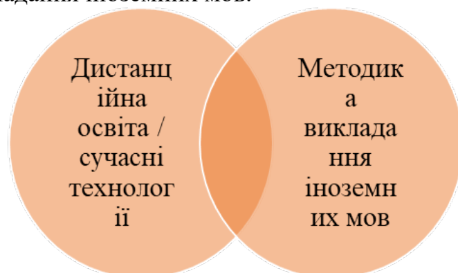
Рис. 1. Проблема відсутності методичної складової для викладання іноземної мови у дистанційному форматі

Відсутність єдиного підходу до розробки методичної складової для викладання іноземної мови у дистанційному форматі гальмує процес оволодіння мовою сучасною студентською молоддю [6]. Відсутність означеного підходу зумовлена тим, що власне проблема знаходиться на перетині двох предметних галузей (рис. 1). Одна з них репрезентує собою дистанційну освіту (сучасні інформаційні технології), наступна – власне методику викладання іноземних мов.