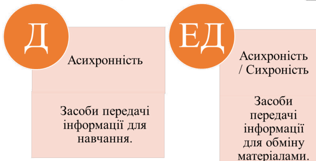
Рис.2. Відмінності між дистанційною і електроннодистанційною формами навчання

Характерними ознаками дистанційного навчання є асинхронність у часі, надання навчального матеріалу через пошту та інші засоби передачі інформації. Електроннодистанційне навчання, в свою чергу, може відбуватися як асинхронно, так і синхронно. Відмітимо, що у цьому випадку зв'язок між викладачем та студентом здійснюється через обмін навчальним матеріалом за допомогою інформаційно-комунікативних технологій.