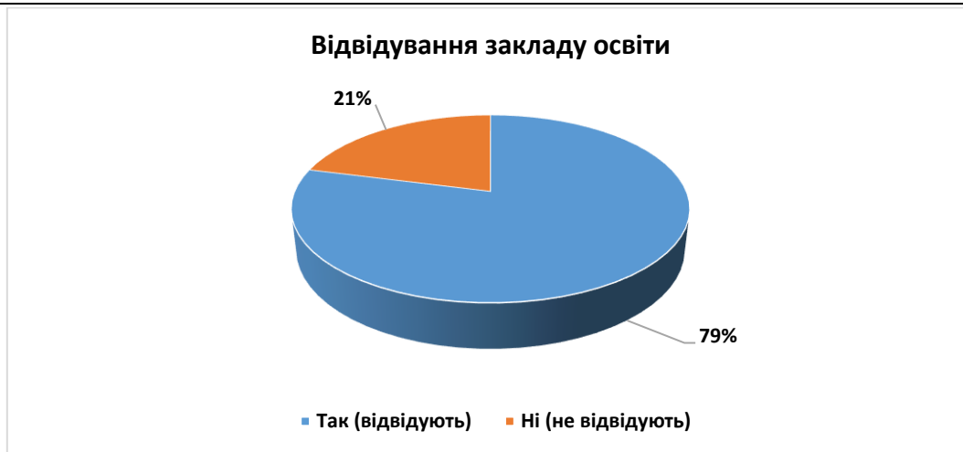
Рис. 1 Відвідування закладу освіти дітьми

Також важливим було конкретизувати тип дошкільного закладу, який відвідують діти. Отримані дані вказують, що загальний дошкільний заклад відвідує 79% дітей та 21% не відвідує жодного закладу освіти. Важливо зазначити, що до даного питання було включено пункт про дошкільний заклад компенсуючого типу для дітей із порушенням мовлення. Однак батьки відзначали, що даний тип закладу для дітей із порушенням мовлення не відвідує жодна дитина. Причину такої відповіді можна лише спрогнозувати за результатами проведених усних бесід між родиною та логопедом, під час