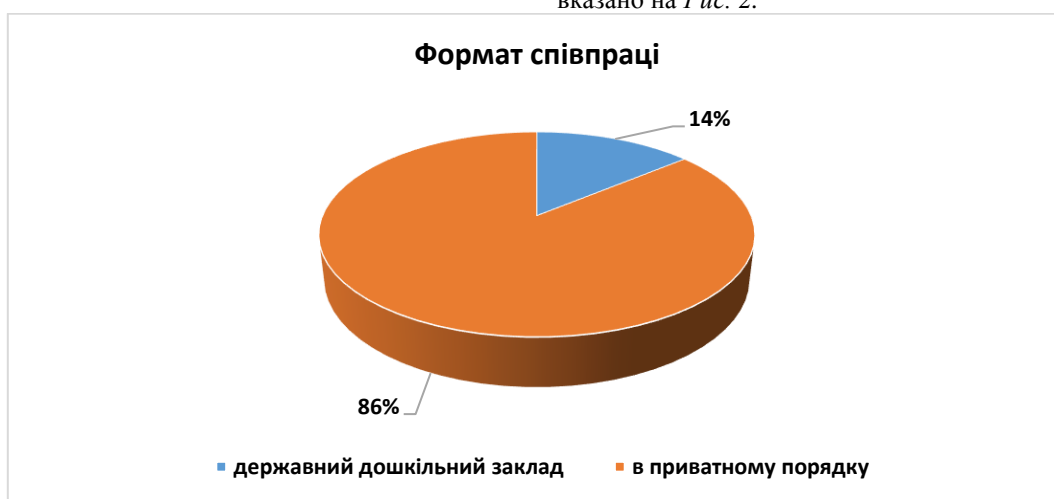
Рис. 2 Формат співпраці з логопедом

З метою з'ясування формату відвідування фахівця, реципієнтам було запропоновано вказати форму співпраці: відвідування дітьми логопеда в державному дошкільному закладі чи співпраця з логопедом в приватному порядку. Отримані дані вказано на Рис. 2.