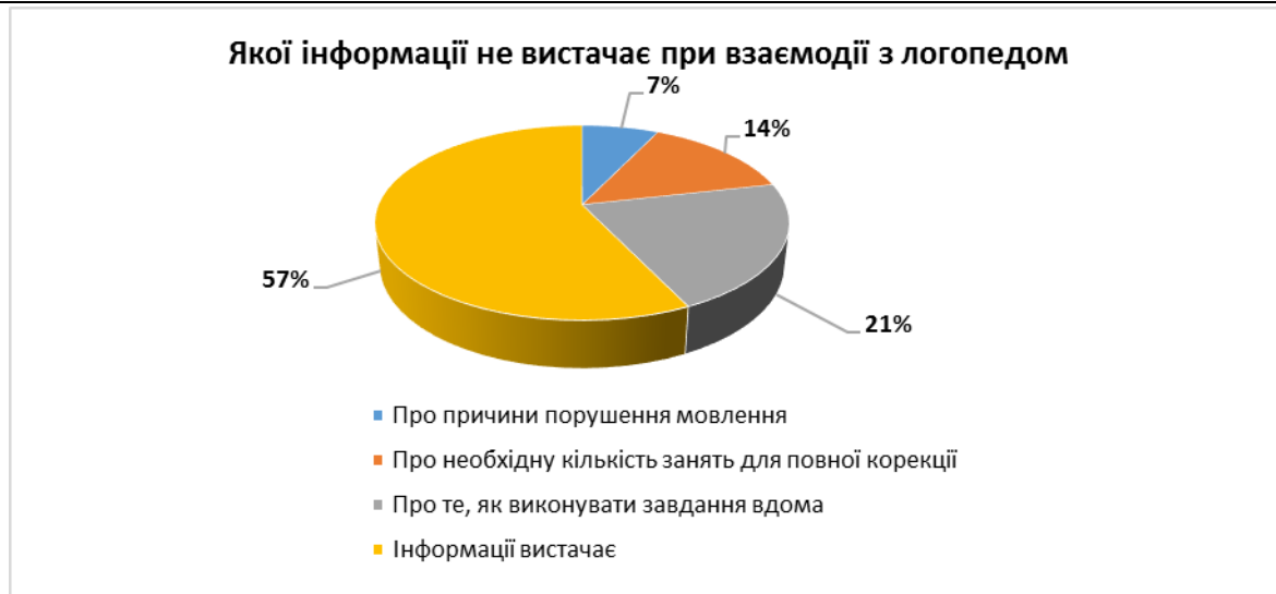
Рис. 3 Інформація, якої не вистачає при взаємодії з логопедом

Задля якісного здійснення аналізу отриманих даних реципієнтам було запропоновано відкрите питання про рекомендації щодо вдосконалення процесу взаємодії батьків/членів родини з логопедом. Це питання важливе, на нашу думку, оскільки якість логопедичного процесу залежить від усіх його учасників.