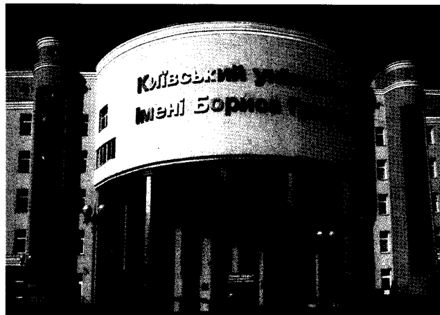
Навчальний корпус Університету на вулиці Маршала Тимошенка, 13-б

Київський університет імені Бориса Грінченка сьогодні - це потужна науково-педагогічна школа вищої освіти, що динамічно розвивається.