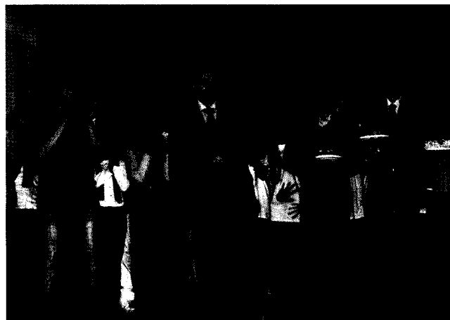
Святкування Дня студента