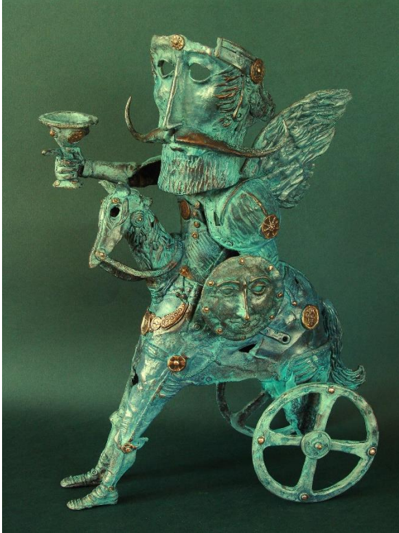
Рис. 6. Денисенко О. «Надія». 2011 р. Бронза.

характерною і для мікенського мистецтва, і для давньоримського, із символікою чаші, яку можна читати як натяк на Грааль, і на чашу Гефсиманського саду, із сонячним диском, одним із найхарактерніших символів, для східних слов'ян у тому числі. Варто лише додати, що у скульптурі, мабуть, багато що з цих образів втілюється навіть раніше, ніж у графіці, у всьому її різноманітті.