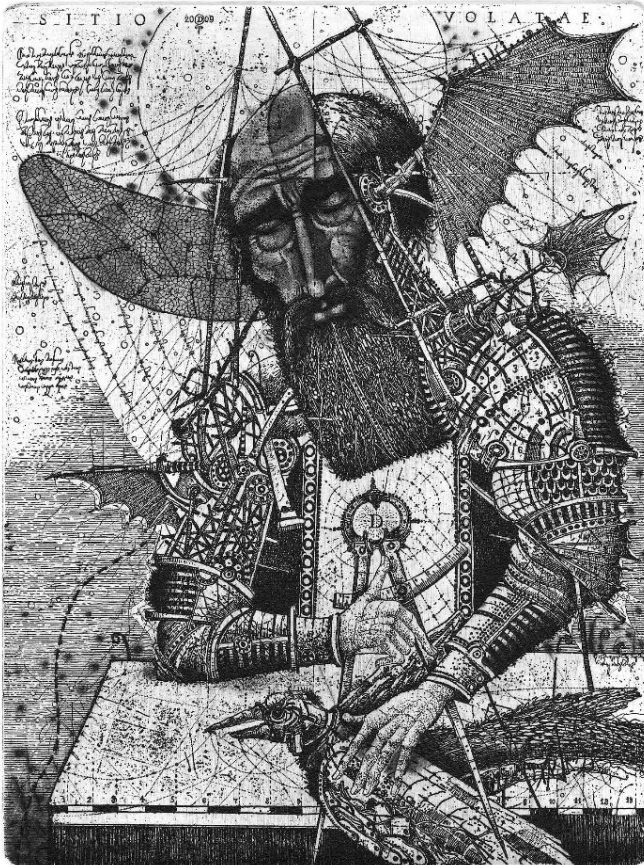
Рис. 2. Денисенко О. «Якщо б я вмів літати». 2008 р. Офорт

ретельністю, на папері ручного відливу, зі вкрапленням альпійських трав, аналогічним користувався і Дюрер, який теж оформлював цей твір.