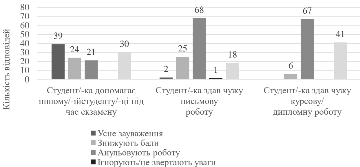
Рисунок 2. Результати анкетування здобувачів, а саме відповіді на запитання: «Що зазвичай роблять викладачі, якщо..?» (n = 114)

порушенням правил академічної доброчесності, які викладені в Положенні про академічну доброчесність (рис. 2).