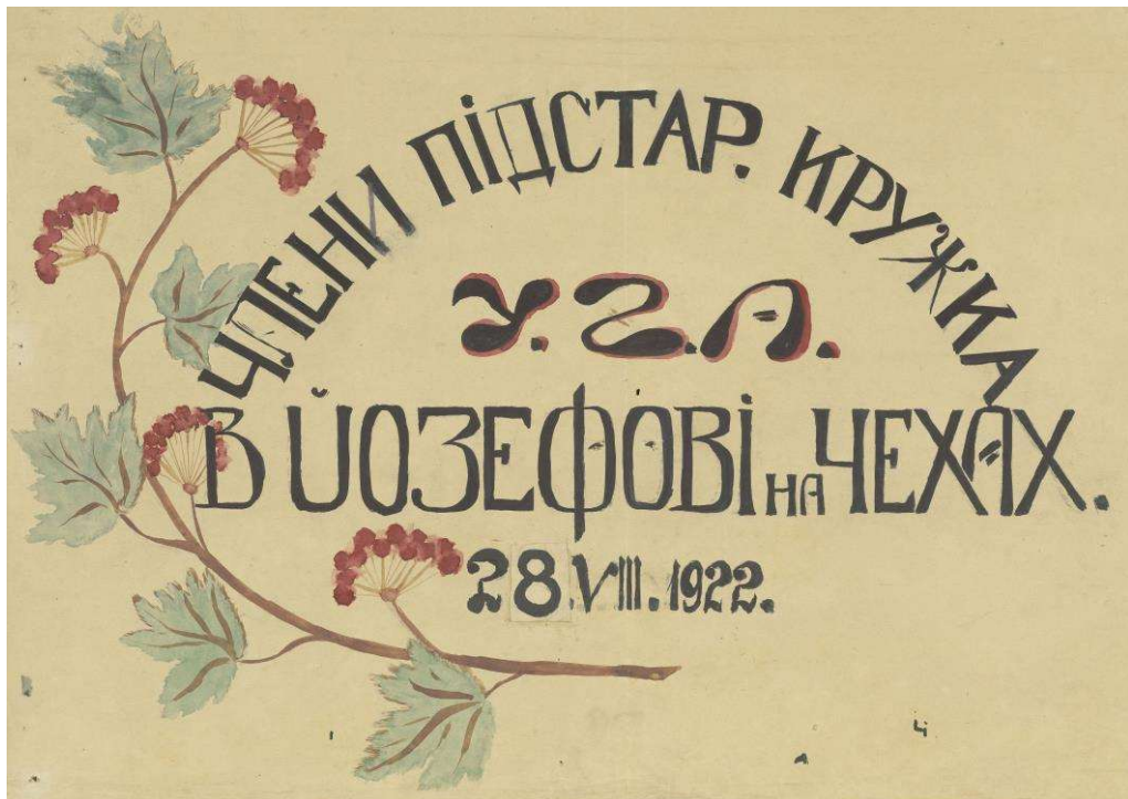
Рис 9. Фрагмент вивіски «Члени Підстарш[инського] Кріжка У.Г.А. в Йозефові на Чехах 28.VIII.1922», Табір Йозефов, 28 серпня 1922 р. Národní knihovna ČR – Slovanská knihovna, f. Speciální sbírky, T-UEP-1-2142.