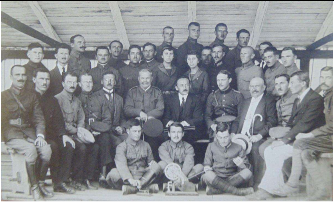
Рис 4. «Група учасників поштово-телеграфічного курсу в Йозефові дня 28.VIII.[1]922 – з іспитовою комісією, фотогр[аф] чет[ар] Слезак Степан». Табір Йозефов, 28 серпня 1922 р. ЦДАВО України, ф.3521, оп.1, спр.10, арк.1.