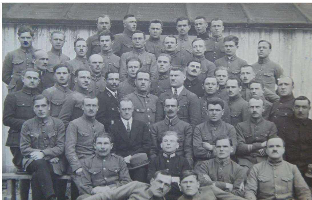
Рис. 3. «Кооперат[ивний] курс КПК в початках свого існування з початком 1922 р.» (надпис на звороті). Табір Йозефов, весна 1922 р. ЦДАВО України, ф.3521, оп.1, спр.10, арк.36.