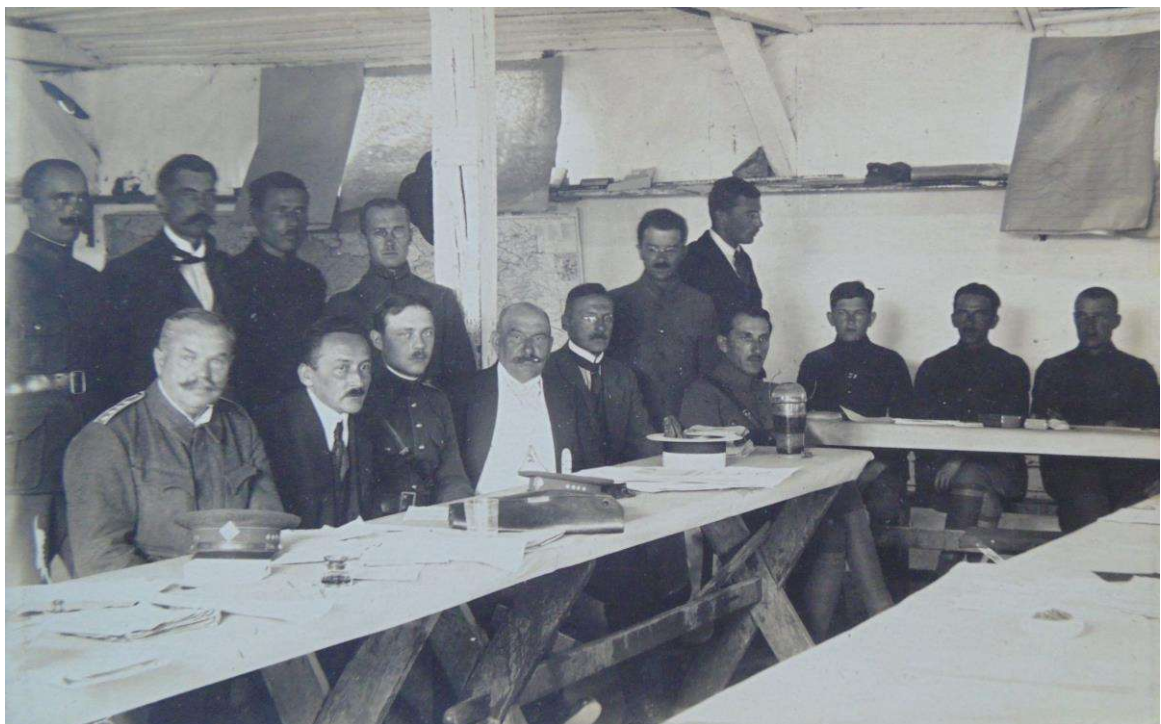
Рис 5. «Іспитова комісія поштово-телеграфічного курсу в Йозефові з послідною (останньою – авт.) партією учеників в іспитовій сали (залі – авт.) дня 28.VIII.1922». Табір Йозефов, 28 серпня 1922 р. ЦДАВО України, ф.3521, оп.1, спр.10, арк.44.