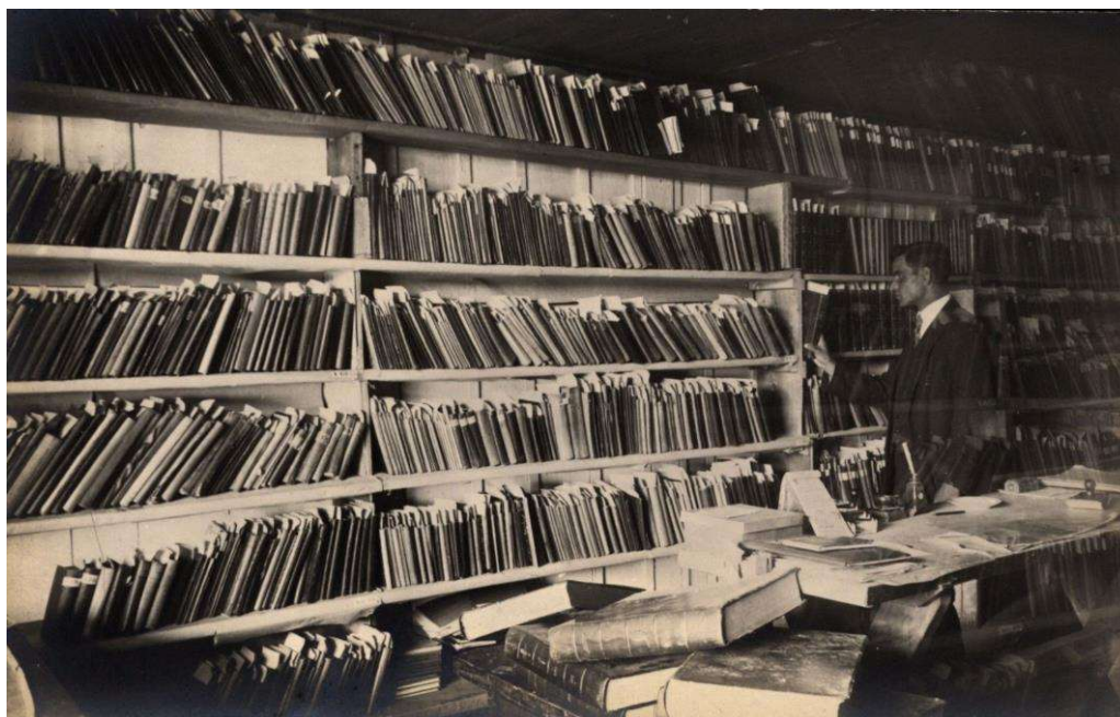
Рис 7. Таборова бібліотека, без зазначення дати. Табір Йозефов.